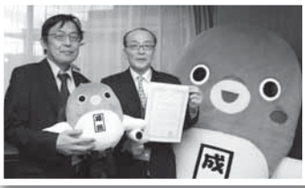
観光庁長官と記念撮影(10日)

平成24年度に実施した定期監査(学校監査)の結果を地方自治法第199条第9項に基づきお知らせ