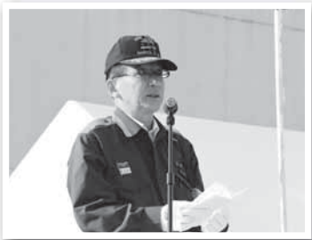
消防操法大会であいさつ(28日)