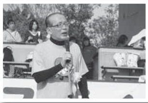
記念すべき第1回成田スポーツフェスティバルの開会式で(6日)