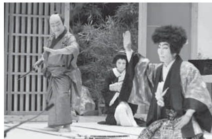
役者たちの熱演を生で

伊能地区の歌舞伎を見て、伝統芸能を身近に感じてみませんか。 日時=11月18日(日) 午前10時~午後3時30分(開場は午前9時30分) 会場=大栄公民館ホール 演目=菅原伝授手習鑑「寺子屋の場」、忠臣蔵九段目「山科閑居の場」 入場料(全席指定)=無料 入場券の配布=10月23日(火)~11月6日(火)の午前9時~午後5時に生涯学習課(市役所5階)、下総支所総務課、大栄公民館で座席指定券を配布します(1人5枚まで) ※くわしくは生涯学習課文化振興室(☎20-1534)へ。