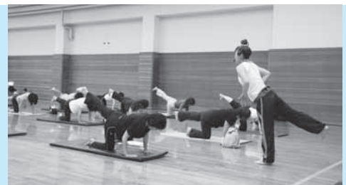
ヨガ教室で健康づくり

会場=市体育館 対象=16歳以上の人(健康増進フィットネス体操は中高年者) 参加費=市内在住の人250円(学生190円)、市外在住の人360円(学生270円)(ウエイトトレーニングは各110円増し) ※申し込みは申込開始日の午前9時から市体育館(☎26-7251)へ。