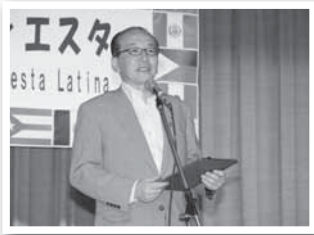
ラテンフィエスタであいさつ(22日)