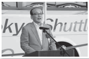
開業記念式典であいさつ(2日)