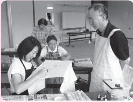
先生の実演を手本に

手描き友禅に本格的に取り組むとなると、30近くの工程を踏む必要がありますが、わたしたちは、大掛かりな道具は使わず、いわば塗り絵のような感覚で手軽に友禅染を楽しんでいます。手描き友禅は、アイロン掛けが可能な布製の素材であれば染めることができるので、Tシャツ・エプロン・手提げ袋など、身近なものも作品に変身します。