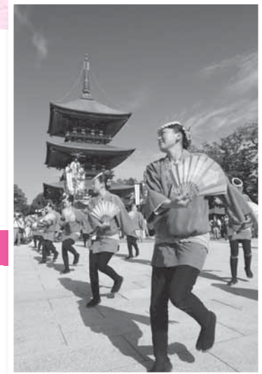
新勝寺大本堂前で踊りを披露