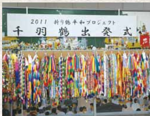
昨年の出発式を前に展示された千羽鶴