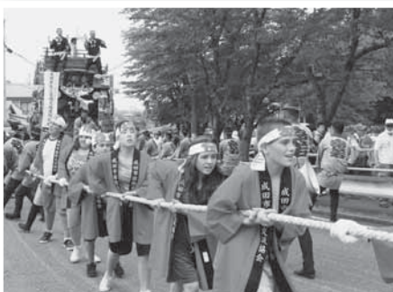
成田の文化を肌で感じる