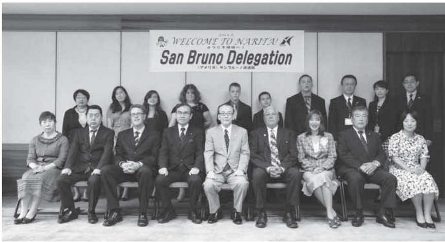
訪問団と記念撮影