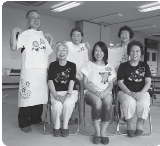
友禅染の数々を身に付けて

作品づくりは題材ごとに同じ下絵から始めます。赤・青・黄の3色の顔料を、いかに自分のイメージに合った色にな