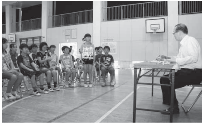
将来の夢を話す児童