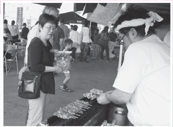
これもおいしそう!