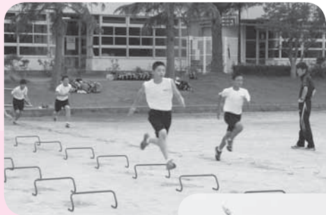
フォームを意識して