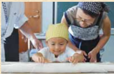
おいしくできるといいな

日時=8月26日(日) 午後2時～4時 会場=成田公民館 対象=小学生とその親 定員=10組20人(先着順) 参加費(1組当たり)=1,500円(教材費) ※申し込みは、午前9時～午後5時に成田公民館(☎24-0787、月曜日・祝日は休館)へ。