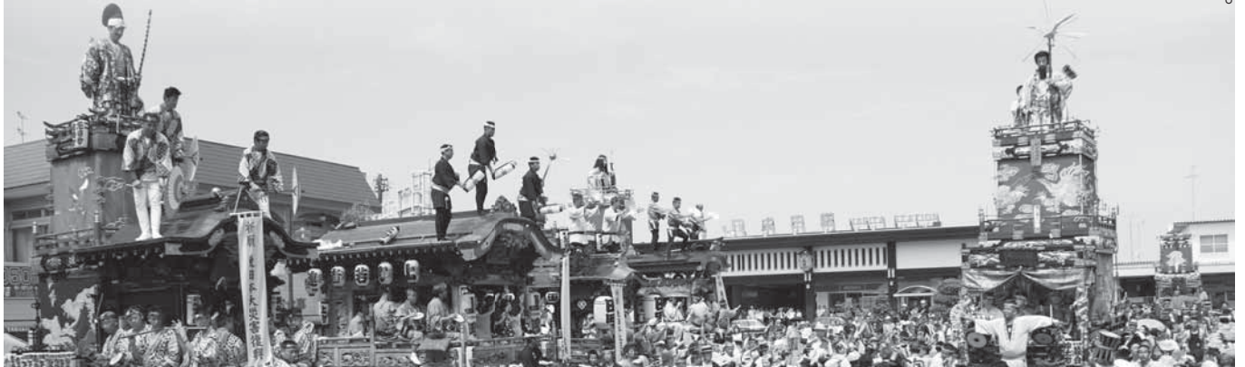
JR成田駅前に山車・屋台が勢ぞろい