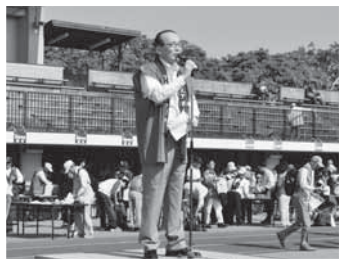
成田エアポートツーデーマーチであいさつ(12日)