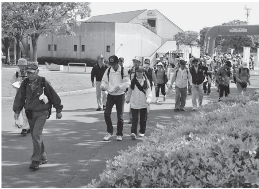
陸上競技場を スタート