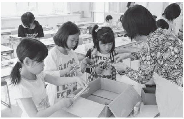
最後の仕上げを慎重に