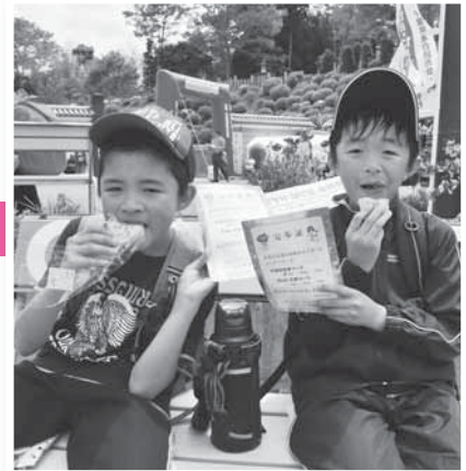
ゴールして完歩証を手にする小学生

成田空港周辺の自然や由緒ある寺などを2日にわたって歩いて巡る「成田エアポートツーデーマーチ」が5月12日・13日に市内などで行われました。コースは、12日が成田空港と芝山仁王尊を巡る2コース、13日が印旛沼と芝山殿塚・姫塚を巡る2コースで、それぞれ10キロ、20キロ、30キロに分かれ、2日間で延べ約2,100人が参加。好天に恵まれ、思い思いのスピードで、ゴールの成田山新勝寺に向かって汗を流しました。