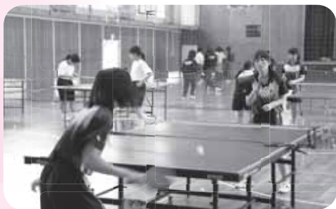
実戦を意識しながら

卓球は男女でプレースタイルが異なります。力でどんどん攻めていく男子に比べ、女子はラリーが長く、チャンスボールでスマッシュを打ちます。