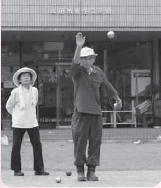
ビュットを目がけて

ペタンクの面白いところは、メンバーで話し合いながらゲームを進めるところ。自分のボールを、ビュットやほかのプレーヤーのボールにぶつけて弾き飛ばすこともでき、ボールで狙う位置などを巡る駆け引きが勝敗を左右します。