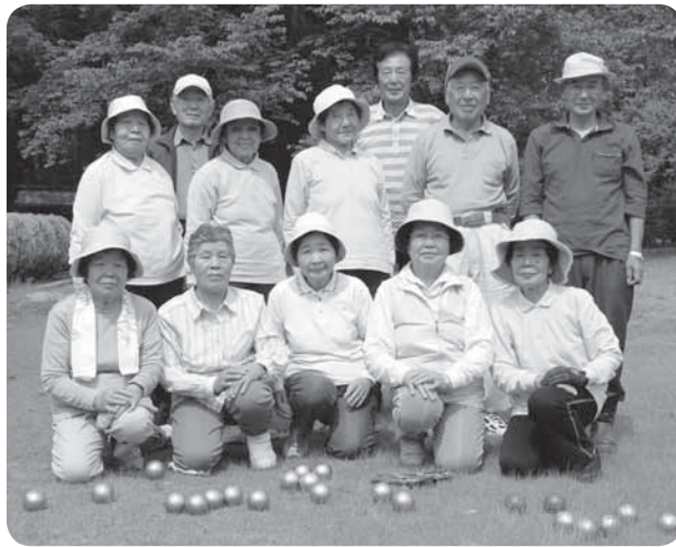
愛用のボールを前に

ビュットとボールの配置に応じて、チームでその都度作戦を立てるのですが、いつの間にか敵味方関係なく、次の一投について相談し合うこともしばしばです。