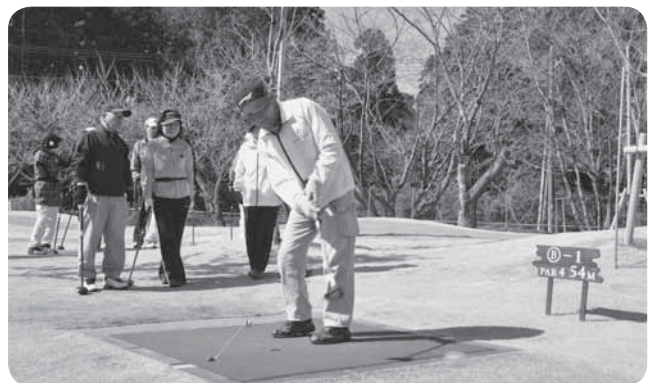
ホールインワンを狙って思い切りスイング

暖かな春の日差しに包まれた3月26日、久住パークゴルフ場で「市民パークゴルフ大会」が開催されました。この日参加した85人は、23組に分かれ全18ホールを2ラウンド回り、スコアを競い合いました。参加者の1人は、「コースを歩くだけで、日ごろの運動不足を解消できるので、これからも続けていきたい」と笑顔で話していました。