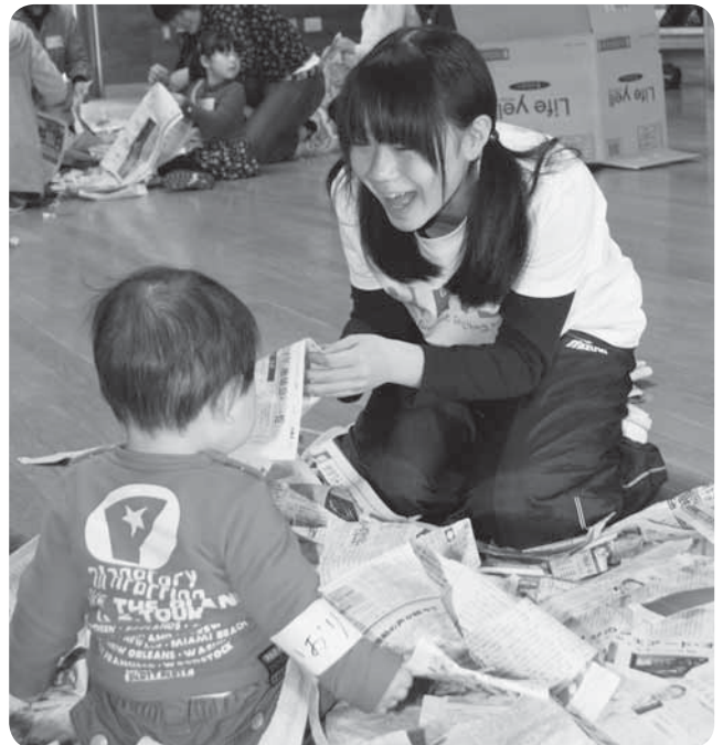
笑顔で語り掛けながら

小中学生に乳幼児とのスキンシップを体験してもらおうと3月24日・27日、「赤ちゃんと一緒に遊んでみよう!」が保健福祉館で開催されました。接し慣れない赤ちゃんたちに、始めは緊張気味だった参加者たちですが、ゲームやお遊戯を通じて次第に打ち解けることができるように。優しく語り掛けたり、抱きかかえたりしながら、赤ちゃんとの触れ合いを楽しんでいました。