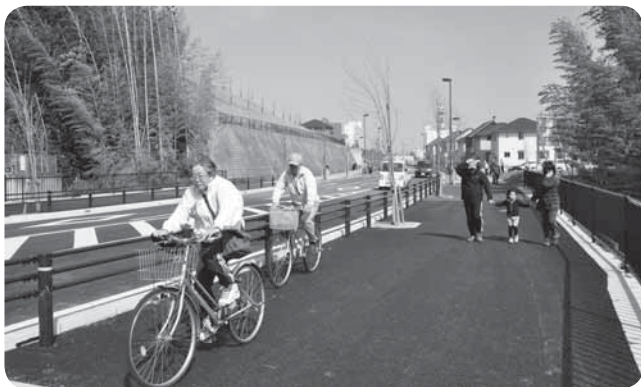
はなのき台と台方のアクセスが改善

成田ニュータウン地区と国道464号を連絡する赤坂台方線(全線2,210メートル)。未整備だった、はなのき台から680メートルが完成し、3月30日に開通しました。