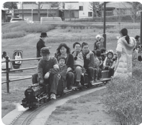
久しぶりのミニSLの運行