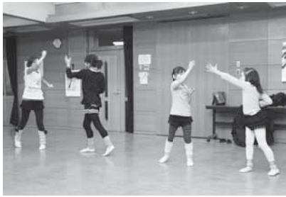
リズムに合わせて

全てのダンスに 応用が利くので、 足の曲げ伸ばし や柔軟体操など には、活動時間 の約半分を費や します。バレエ の練習には、本 来は、専用の設 備や大型の鏡な