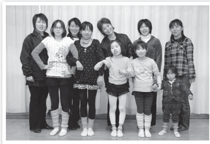
みんなで楽しく踊りませんか

どが必要ですが、わたしたちは、窓に映る姿で体の動きをチェックしたり、事務机の端で体を支えたりと、限られた条件の中で練習できるよう工夫しています。 わたしたちは現在、4月に行われる発表会に向けた練習の真っ最中。長い期間みんなで練習を重ねてきたダンスを披露して、発表会で満場の拍手を受けたときの達成感は格別です。皆さんも、わたしたちと一緒にダンスを楽しんでみませんか。