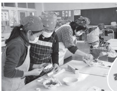
作業の一つ一つを丁寧に

に喜んでもらえるよう、おいしい料理や楽しい手芸のレパートリーを広げていきたいと思っています。