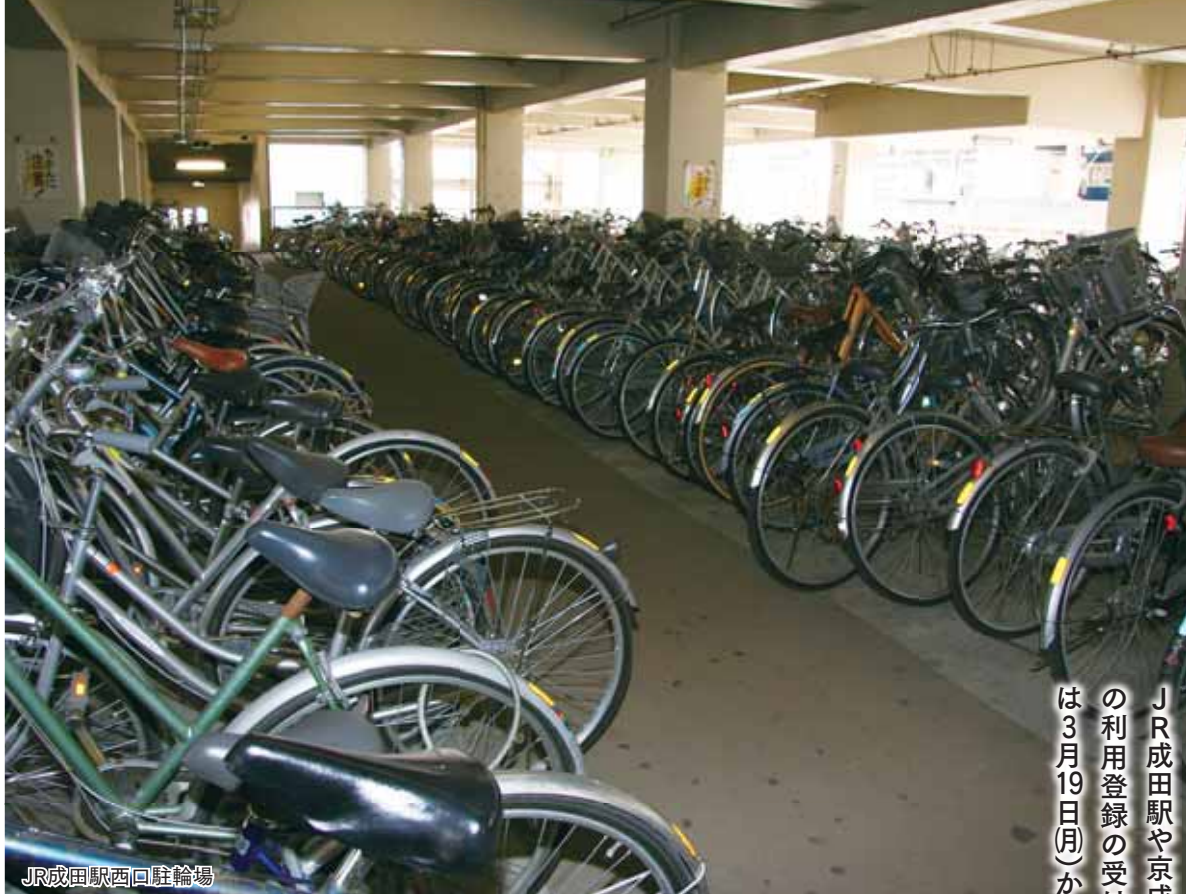
JR成田駅西口駐輪場

JR成田駅や京成成田駅周辺にある登録制駐輪場の利用登録の受け付けを、3月18日(日)(市民以外は3月19日(月))から開始します。