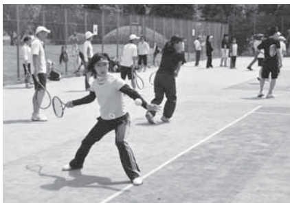
正確なショットを身に付けよう