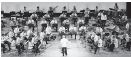
マンドリンの美しい音色が響く

申込方法=11月30日(水)(当日消印有効)までに、往復はがき(1枚3人まで)に代表者の住所・氏名・電話番号・応募者全員の氏名を書いて生涯学習課明大係(〒286-8585 花崎町760)へ ※くわしくは同課(☎20-1583)へ。