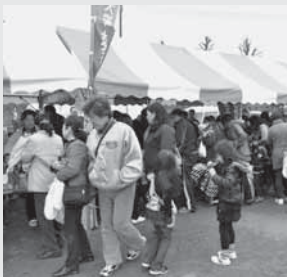
多くの模擬店が出店