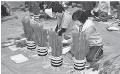
手作りの門松でお正月を

日時=12月17日(土) 午後1時~5時 会場=下総公民館 内容=ミニ門松作り 定員=30人(先着順) 参加費=1対1,500円程度(材料費) ※小学生以下は保護者同伴。申し込みは 午前9時~午後5時に、下総公民館(☎ 96-0090、月曜日・祝日は休館)へ。