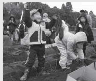
サツマイモ採れた!