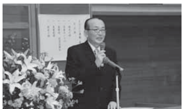
よい歯のコンクールであいさつ(16日)