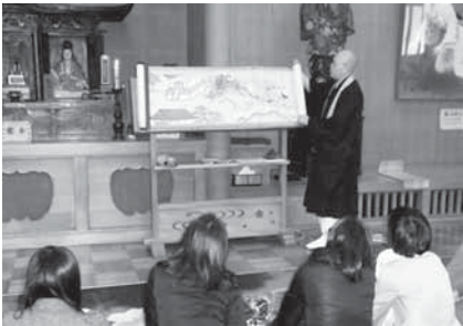
絵巻を使って解説を受ける