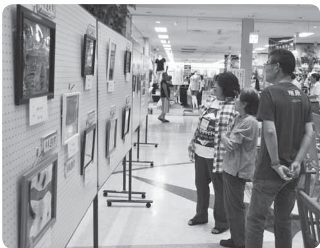
未来に伝えたい“成田の魅力”がいっぱい

文化遺産や自然遺産を未来に伝えていくことを目的に、ユネスコが推進する「未来遺産運動」。その活動の一環として7月18日～23日、「成田の地域遺産写真展」がユアエルム成田店で開催されました。展示されたのは、市内の風景や文化財、祭りなどを撮影した32点の写真。買い物に訪れた家族連れなどが足を止め、展示された作品の数々を興味深げに見つめていました。