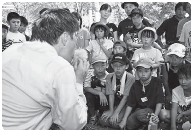
火起こしの実演。麻綿から煙が出てきたぞ

遊びや学習を通して子どもたちに行動力や協調性を養ってもらおうと市内15の小学校区・地区で行われている「成田わくわくひろば」の参加者が集まり、7月16日・17日に坂田ケ池総合公園で「2011