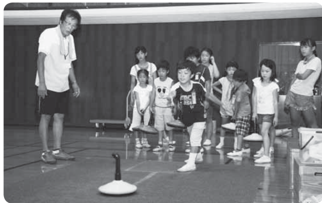
ストーンの距離は伸びるか

レクリエーションとして気軽にできるスポーツを楽しんでもらおうと7月16日、市体育館で「ニュースポーツフェスタIN成田」が開催されました。参加者が楽しんだのは、ユニカール・ベタンク・バウンドテニスなどの8種目。参加者は、初めて体験する競技に緊張しながらも、ルールを教えもらいながら楽しんでいました。