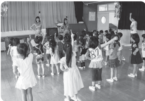
保育園でダンス教室

プロ野球の「イースタンリーグ公式戦 成田スカイシリーズ千葉ロッテマリリンズ対埼玉西武ライオンズ」が7月28日、ナスパ・スタジアムで行われました。プロ野球選手のプレーを間近で見られるとあって、球場に集まった観客は2,328人。試合は、開始当初からの雨の影響で6回で打ち切られましたが、選手たち一つ一つのプレーに大人も子どもも目を輝かせていました。試合の前日には千葉ロッテマリリンズキャラバン隊による「ダンス&野球教室」が市内の保育園で行われました。マスコットキャラクターのリンちゃんも登場し、園児たちは大喜びでした。