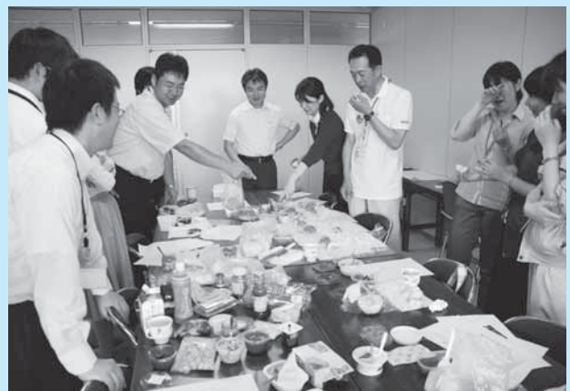
“成田の新しいおいしさ”を開発中

※くわしくは企画政策課(☎20-1500)、ロケ誘致についてくわしくは観光プロモーション課(☎20-1540)へ。