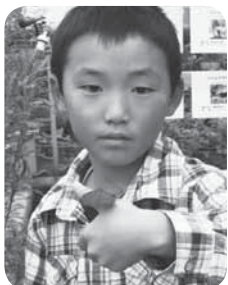
チョウが手に止まったよ

魅力的な体験を通じ、子どもたちに学ぶことの楽しさを知ってもらおうと実施されている「こども体験セミナー」。7月23日、その3回目となる「自然体験『昆虫館・蝶の生態観察』」が、成田西陵高校で開催されました。参加した子どもたちは、「昆虫館」に並ぶ標本や、「蝶の生態館」の中を自由に飛び回るチョウを観察。ヘラクレスオオカブトやオオゴマダラなど、普段は目にすることのない昆虫やチョウの姿に目を輝かせ、歓声を上げていました。