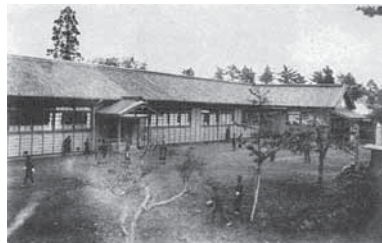
八生実業補習学校は、大正3(1914)年に八生農学校と改称された(「創立百周年記念誌 千葉県立成田西陵高等学校」より)