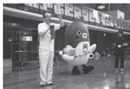
うなりくんと一緒にあいさつ(16日)