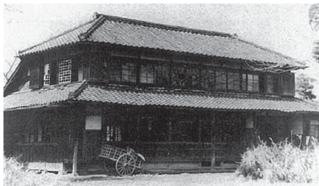
中郷村芦田の民家を移築し、明治44(1911)年に建てられた八生村役場。場所は、現在の成田西陵高校グラウンド付近(「成田の歴史アルバム」より)

また、村内では、地元青年団員が東奔西走して本を収集して創設された八生村図書館が、大正12(1923)年、八生尋常小学校内に開館しています。村費と寄付で運営されたこの図書館では、図書館報の各戸配布、巡回文庫の創設などの積極的な活動が行われ、翌年、成績優良図書館として県知事から表彰されています。こうした取り組みは、成田西陵高校の歴史とともに、村民の教育に対する意識の高さを示しています。