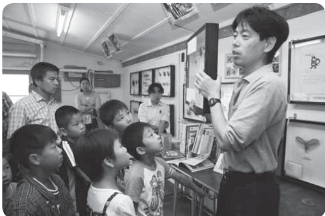
珍しい昆虫の標本に興味津津