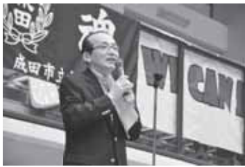
ママさん選手を激励(19日)