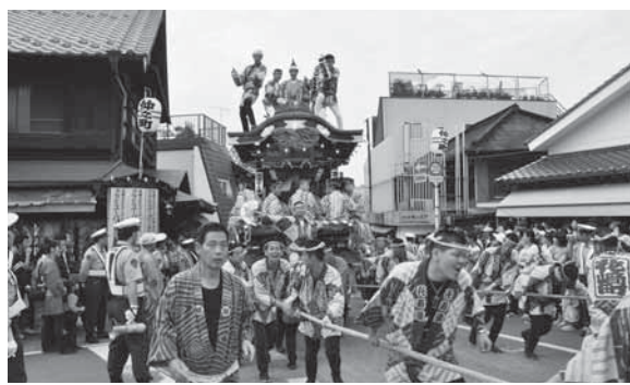
3日間、街中が活気づく

き廻され、午後1時30分ごろから参道途中の仲之町の坂を駆け上がる「総引き」が行われます。山車・屋台は、午後10時30分まで各町内を曳き廻されます。また、午後4時30分には、新勝寺大本堂前に御輿と山車・屋台が勢ぞろいし、御輿還御法楽後、お囃子と踊りの競演が行われます。 ※くわしくは成田市観光協会 ☎ 22-21102 または成田観光館 ☎ 24-32323 へ。