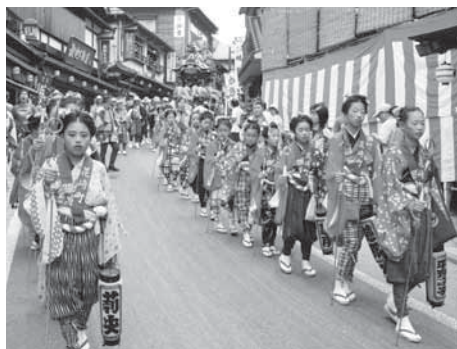
祭りを彩る手古舞

しませす。 題材＝成田祇園祭期間中(7月8日～10日)の御輿、山車・屋台のスナップなど祭りの風習 サイズ＝カラープリント四つ切