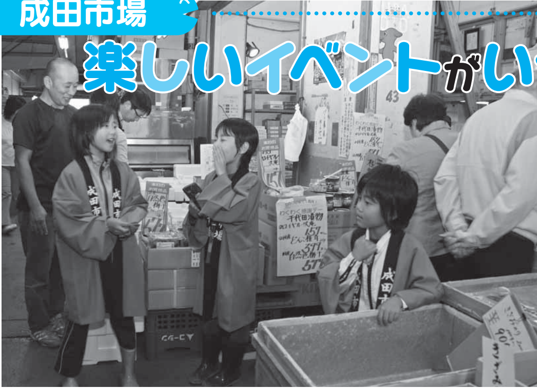
市場探検隊でお客様の呼び込み

多くの小売店・料理店が仕入れに訪れるのが卸売市場ですが、市民の皆さんも、生鮮食品などの買い出しに来場したことがあるのではないのでしょうか。卸売市場では、多くの市民の皆さんに親しんでもらおうと、さまざまな催し物を行っています。