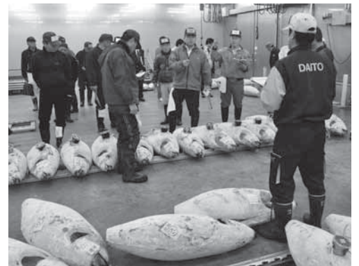
早朝卸売市場見学で競り場を体験