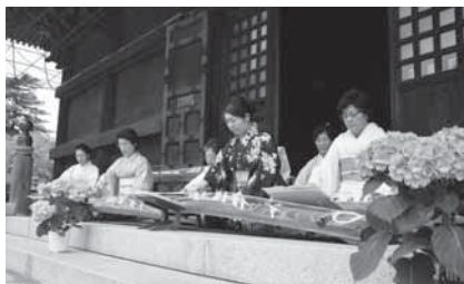
箏の音色にうっとり

※期間中の日曜日、午前10時~午後3時に、箏・尺八・二胡などの演奏やお茶会が開催されます。くわしくは「紫陽花植樹による観光地づくり」実行委員会事務局(☎22-2102)へ。