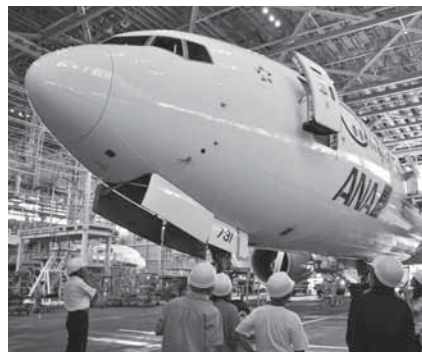
格納庫で整備中の機体を見学

期日=6月29日(水) 集合時間=午前8時45分(午後3時30分解散) 集合場所=市役所1階ロビー 見学コース=卸売市場、下総歴史民俗資料館・下総公民館(昼食)、全日空成田第一格納庫 対象=市内在住の人 定員=36人(応募者多数は抽選) 参加費=無料(昼食は各自で用意) ※申し込みは6月10日(金)までに広報課(☎20-1503)へ。