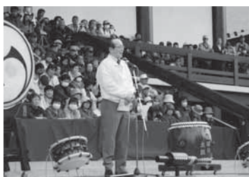
成田太鼓祭であいさつ