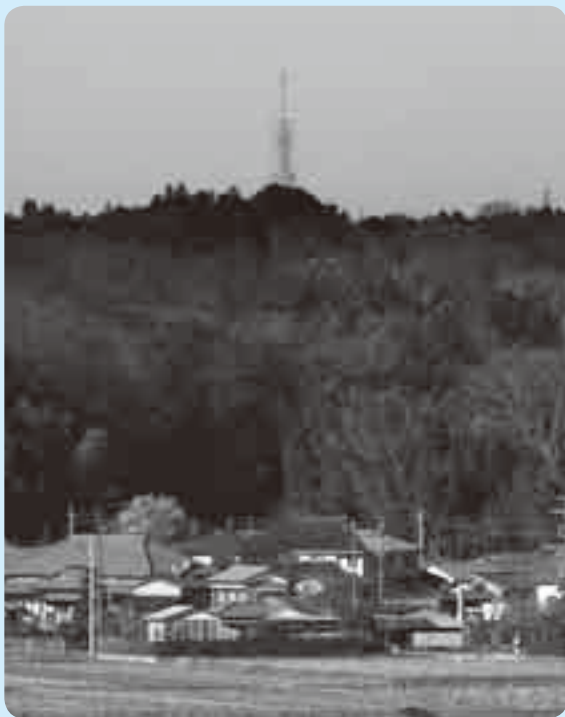
撮影場所からは、展望台の輪郭もくっきりと

3月1日に高さ600メートルを突破し、自立式電波塔で「世界一」となった東京スカイツリー。市内からも見えるという噂を聞きつけ、早速撮影してみました。写真は八代地先から撮ったものです。皆さんも、自分だけの撮影スポットを探してみたいかがでしょうか。