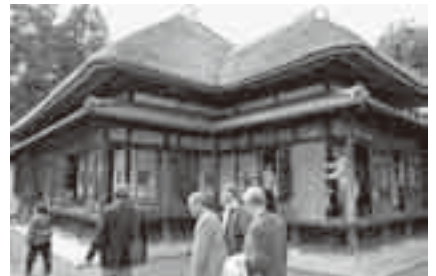
皇室ゆかりの施設を見学