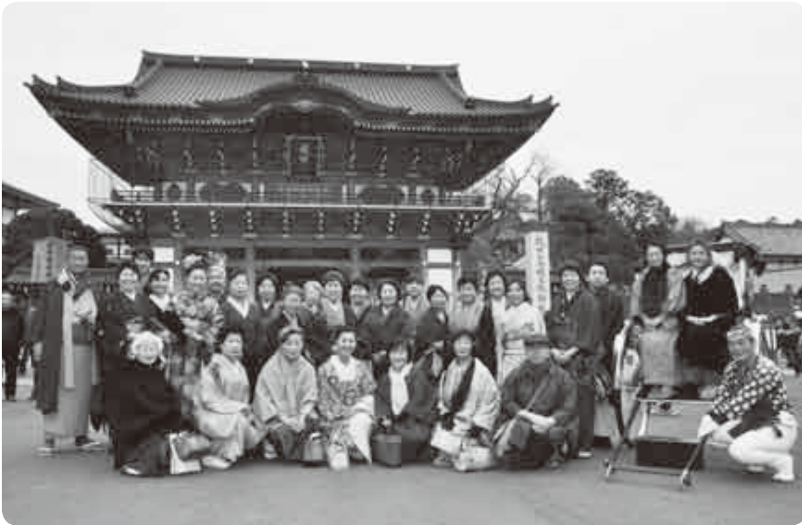
新勝寺総門前でパチリ