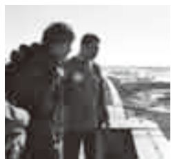
ロケハンで市内のホテル屋上から空港を眺める