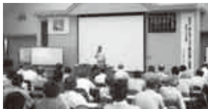
分かりやすい講義も大好評

※日程や内容は変更する場合があります。緑地環境課程は、正規の授業のほかに実習農地の管理作業があります。講義運営ボランティア「運営委員」も同時に募集します。くわしくは生涯学習課(☎20-1583)へ。