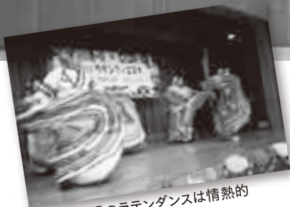
本場のラテンダンスは情熱的「ラテン・フィエスタ」