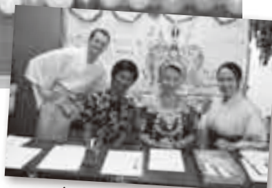
会員相互の情報交換の場「会員交流イベント」