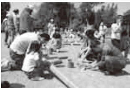
タケノコ掘りの後は竹細工を楽しもう

日時=4月16日(土) 午前9時~正午 会場=八生公民館 内容=親子でタケノコ掘りと竹細工を体験する 対象=小学生と保護者 定員=16組(応募者多数は抽選) 参加費=無料 申込方法=3月31日(木)(必着)までに、はがきに住所・氏名(フリガナ)・性別・学校名と学年・電話番号・保護者名を書いて八生公民館(〒286-0846 松崎317)へ ※くわしくは同館(☎27-1533、月曜日・祝日・3月22日(火)は休館)へ。