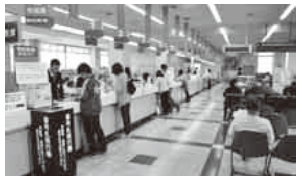
休日窓口サービスを毎週日曜日に

自主財源を確保するとともに、市民負担の公平性を確保するため、市税や国民健康保険税のほか、介護保険料、後期高齢者医療保険料、保育料、下水道使用料などの未収債権の徴収を一元的に行う部署を新設し、収納率の向上を図ります。市民の自主的な活動を世代を超えた相互交流を促す施設として、コミュニケーション機能を核とした、公津の杜複合施設の建設を進めていきます。