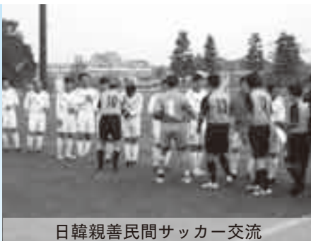
日韓親善民間サッカー交流