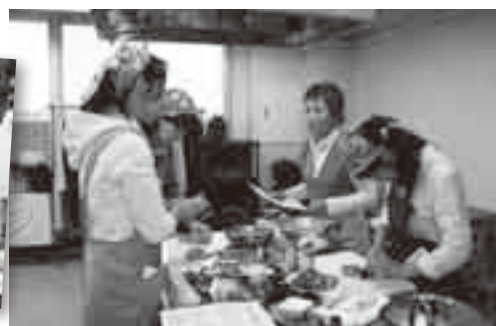
楽しみ味わいながら各国の伝統料理の作り方を覚える「世界の料理を楽しむ会」