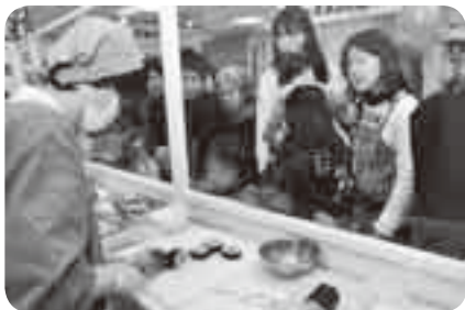
太巻き寿司の実演に興味津々

暮らしに役立つ情報の提供や催しなどを通じて生活を改善するヒントにしておらおうと2月26日・27日、ボンベルタ成田店で「消費生活展」が開催されました。各ブースでは、市や地元企業が「食の安全」や「省エネ」などをテーマに、企画展示や啓発活動を実施。「太巻き寿司の実演と試食」など、子どもも楽しめる催しも行われ、会場は多くの家族連れでにぎわっていました。