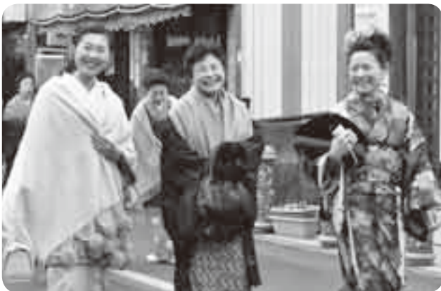
一緒に楽しみませんか

着物姿で参道を散歩するイベント「きもの de 成田」が2月20日、表参道で行われました。この催しは、着る機会の減ってしまった着物などを有効活用し、日本の伝統である和装を楽しもうと行われたもので、県内外から約40人の男女が参加。市内在住で親子で参加したという女性は「鮮やかな着物を着ると、日本人でよかったとしみじみ思います」と話していました。次回は5月15日(日)に開催予定(申込不要、参加費無料)で、今後も継続して開催していくことです。