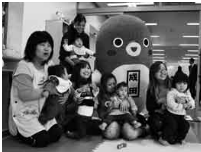
子どもにも大人気の「うなりくん」

保育園の整備については、開設後30年を超えるニュータウン地区の各保育園について、順次、大規模改修を行うための代替施設となる仮設園舎の整備を進めます。また、4月から中台児童ホームを中台小学校の校舎内に移設するとともに、向台小学校の敷地内に建設中の向台児童ホームと向台第2児童ホームをオープンします。さらに、はなのき台地区の人口の増加に伴い児童が急増する吾妻小学校の敷地内に、児童ホームの整備を進め、放課後における留守家庭児