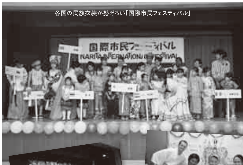
各国の民族衣装が勢ぞろい「国際市民フェスティバル」

市民と在住外国人の交流の場として、「ラテン・フィエスタ」(7月)や「新春を祝う会」(2月)など、世界の伝統・文化を楽しみながら体験できるイベントや、会員相互の交流イベントを定期的開催しています。