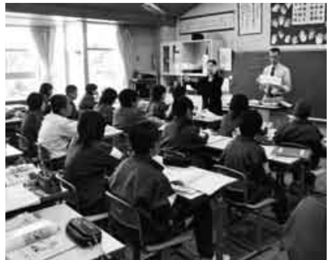
英語科学習を充実

4月から中郷小学校を美郷台小学校へ統合するとともに、久住第一小学校と久住第二小学校を統合し、久住小学校として新たな出発をします。これに伴い、久住小学校の増築と大規模改造工事を進めます。また、下総地区の4つの小学校を平成26年4月に統合することから、統合小学校建設のための実施設計を行います。さらに、西中学校の分離新設校として公津の杜中学校の新築工事に着手するとともに、公津の杜小学校の増築工事を進めます。