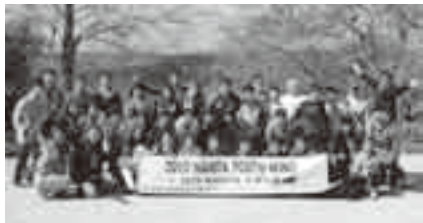
夏の思い出づくりに