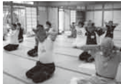
自彊術でスッキリ