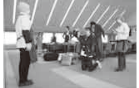
市役所で行われた衣装合わせ