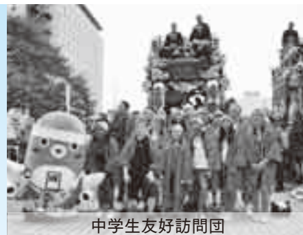
中学生友好訪問団