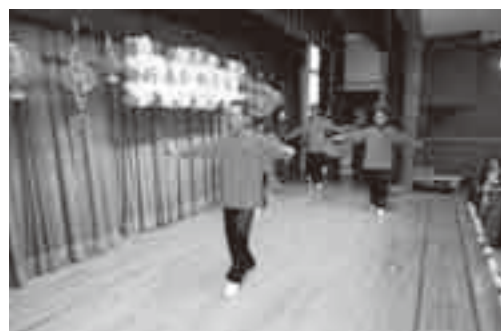
アジア圏の旧正月をお祝い「新春を祝う会」