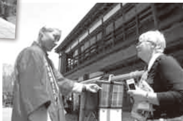
語学力を生かして案内