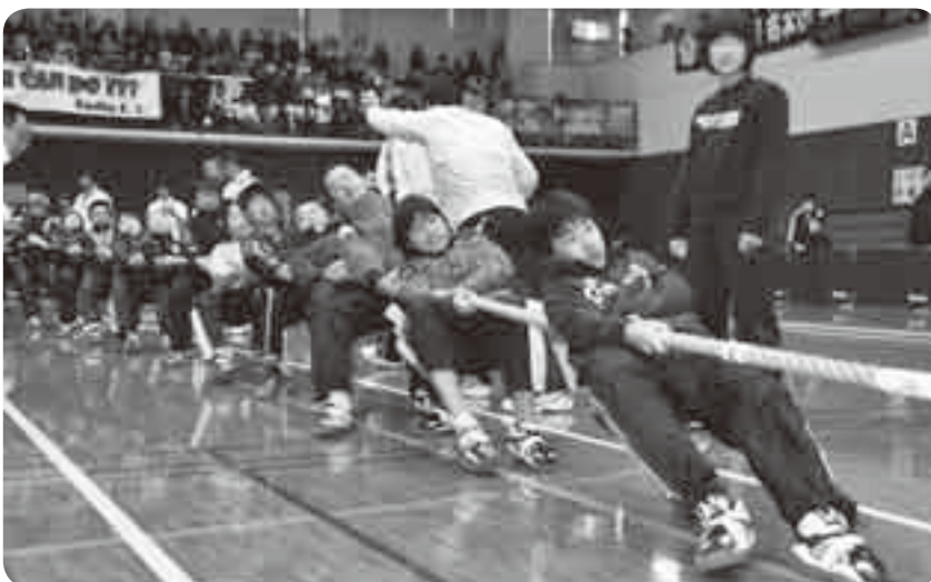
抜群のチームワークを披露した成田King