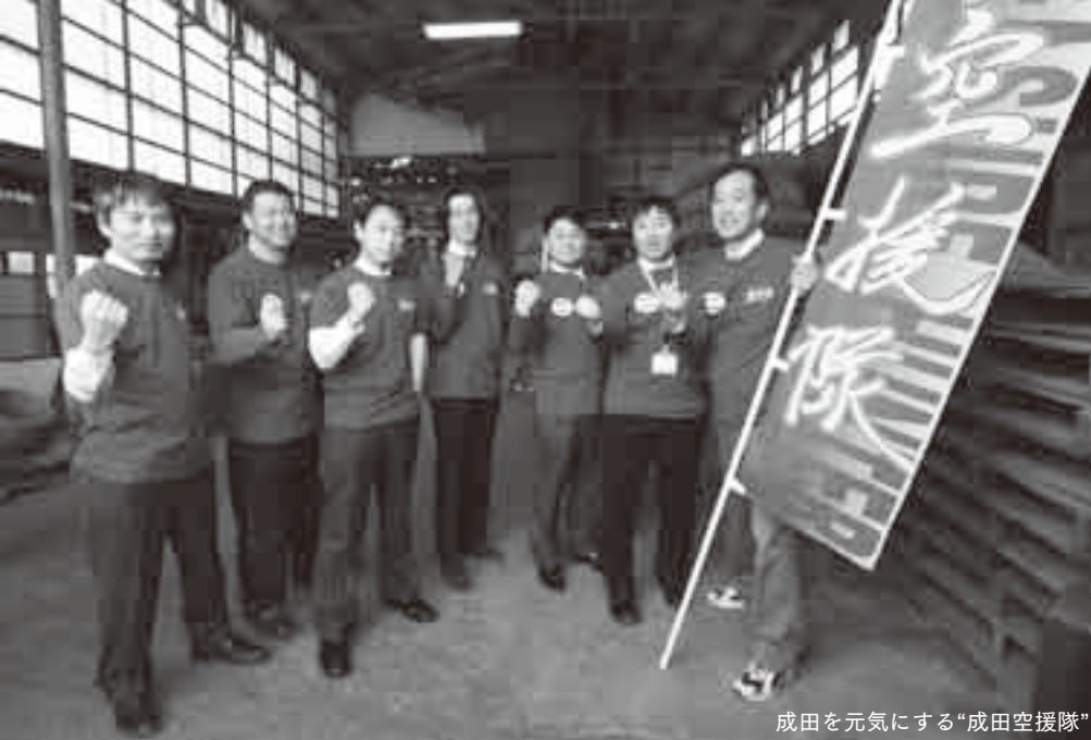
成田を元気にする“成田空援隊”