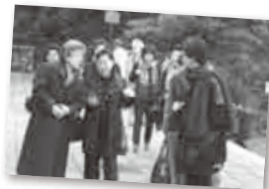
訪問団の視察時の通訳

ほかにも、日本文化紹介、ホストファミリー、国際交流支援などのボランティアとして協力してくれる人を随時募集しています。