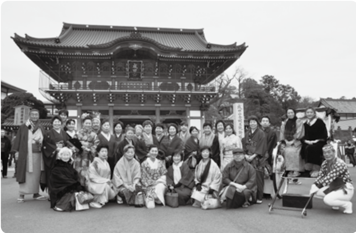
新勝寺総門前でパチリ