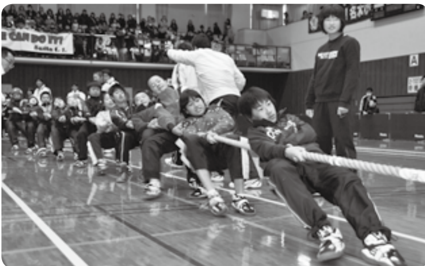
抜群のチームワークを披露した成田King

着物姿で参道を散歩するイベント「きもの de 成田」が2月20日、表参道で行われました。この催しは、着る機会の減ってしまった着物などを有効活用し、日本の伝統である和装を楽しもうと行われたもので、県内外から約40人の男女が参加。市内在住で親子で参加したという女性は「鮮やかな着物を着ると、日本人でよかったとしみじみ思います」と話していました。次回は5月15日(日)に開催予定(申込不要、参加費無料)で、今後も継続して開催していくことです。