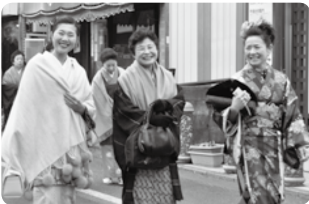
一緒に楽しみませんか

着物姿で参道を散歩するイベント「きもの de 成田」が2月20日、表参道で行われました。この催しは、着る機会の減ってしまった着物などを有効活用し、日本の伝統である和装を楽しもうと行われたもので、県内外から約40人の男女が参加。市内在住で親子で参加したという女性は「鮮やかな着物を着ると、日本人でよかったとしみじみ思います」と話していました。次回は5月15日(日)に開催予定(申込不要、参加費無料)で、今後も継続して開催していくことです。