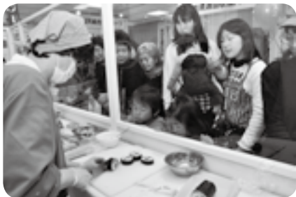
太巻き寿司の実演に興味津々

暮らしに役立つ情報の提供や催しなどを通じて生活を改善するヒントにしてみよう。2月26日・27日、ボンベルタ成田店で「消費生活展」が開催されました。各ブースでは、市や地元企業が「食の安全」や「省エネ」などをテーマに、企画展示や啓発活動を実施。「太巻き寿司の実演と試食」など、子どもも楽しめる催しも行われ、会場は多くの家族連れでにぎわっていました。