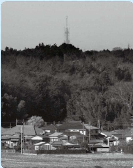
撮影場所からは、展望台の輪郭もくっきりと

3月1日に高さ600メートルを突破し、自立式電波塔で「世界一」となった東京スカイツリー。市内からも見えるという噂を聞きつけ、早速撮影してみました。写真は八代地先から撮ったものです。皆さんも、自分だけの撮影スポットを探してみたいかがでしょうか。