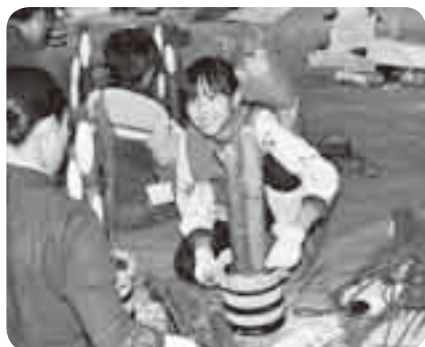
竹を挿して「門松」らしくなり思わずニコリ

新年を間近に控えた12月19日、下総公民館で「ミニ門松づくり教室」が開催されました。土台となる空き缶にわらを巻き、シュロ縄で固定したものに土を入れて、竹と松を見栄えよく挿し、ミニ門松が完成。わらを編んだり、シュロ縄を花形に結んだりといった慣れない作業が続きましたが、親子で仲良く作業をしたり、友達同士互いに出来を確認したりしながら、笑顔で新年の準備に取り組みました。