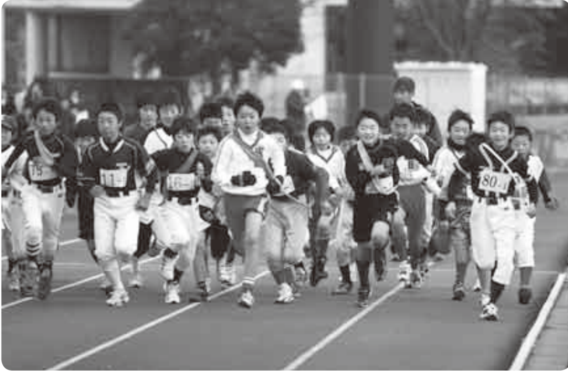
チームの威信を懸けて、一斉にスタート