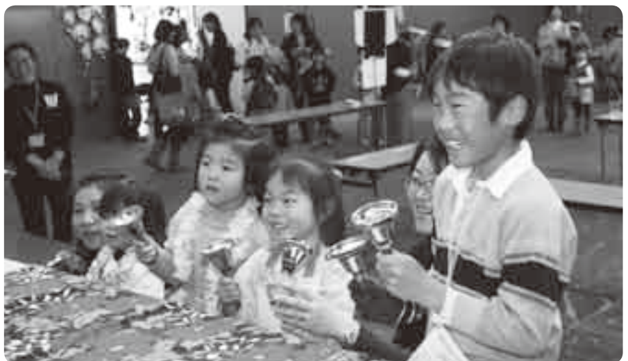
ハンドベルの演奏って難しいけど楽しい

歌や踊り、体験活動を通して子どもたち楽しんでもらおうと12月23日、国際文化会館で「なりDAN☆フェスティバル」が行われました。歌や踊りの発表では、8つのグループが日ごろの練習の成果を披露。ハンドベルやスライム作りなどの体験コーナーに参加した子どもたちは、「みんなで呼吸を合わせて曲を演奏できてうれしかったです」「スライムは、感触がおもしろいです」と大満足の様子でした。