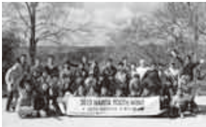
心に残る貴重な体験