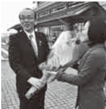
花束の贈呈を受ける(28日)

○介護保険料払込証明：介護保険課(市役所議会議棟1階)、下総・大栄支所市民福祉課