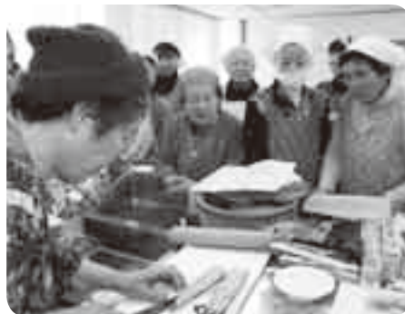
先生のお手本をよく見て

伝統の味「太巻きずし」の技法を多くの人に知ってもらおうと12月10日、「おふくろの味教室」が保健福祉館大栄分館で行われました。今回チャレンジしたのは、「さざんか」と“四海巻き”。参加者は6班に分かれ、講師のお手本を参考に、具材の入れ方やのりの巻き方などを確認しながら作っていました。完成すると「さざんかの形がとてもきれいなね」「具材がちやんと真ん中にあるね」と、出来栄をお互いに褒め合いながら、手作りの味を楽しんでいました。