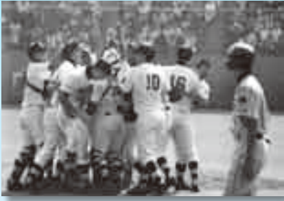
20年ぶりの甲子園行きを決め、抱き合う成高ナイン