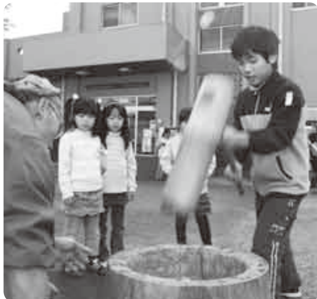
大人用の杵を上手に使うなんて、見事！

杵 きね と臼を使った餅つきを子どもたちに体験してもらおうと12月12日、子ども館で「お餅つきをしよう」が行われました。参加者たちは、通常よりも軽量・小型に作られた子ども用の杵でペタンペタン。中には、通常の杵を見事に使いこなし、大人顔負けの力を見せる参加者もいました。つきたての餅をほお張ると、思わず笑顔を見せた子どもたち。自分でついた餅の味は格別だったようです。