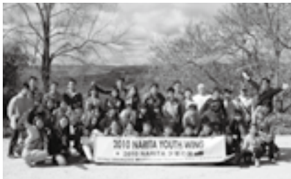
心に残る貴重な体験