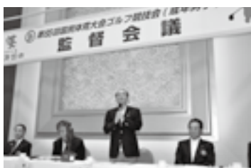
ゆめ半島千葉国体ゴルフ競技監督会議で