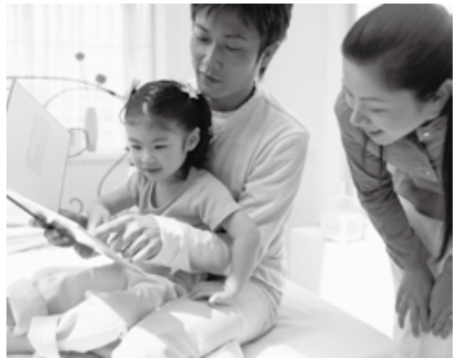
社会全体で子育てを支援