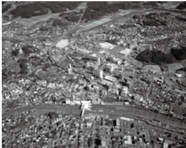
土地の有効利用で駅周辺を活性化

JR・京成成田駅中央口地区整備事業 …… 12億2,564万円 JR成田駅東口市街地再開発事業を推進し、再開発ビルの建設と駅前広場の整備を行う