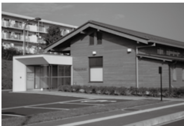
初期救急医療体制を万全に