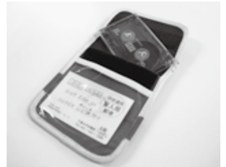
希望する人にお届けしています