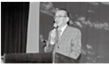
子ども会まつりであいさつ