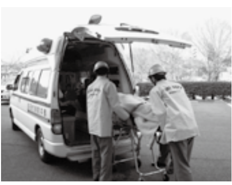
一刻を争う人のために

緊急ではないのに救急車を要請すると、本当に必要な人の所への到着が遅れ、救える命を救えなくなる恐れがあります。症状により緊急性がない場合には、自家用車などで病院に行くように皆さんの