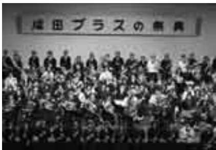
迫力ある演奏に触れる