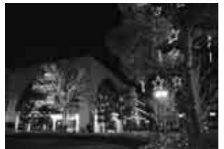
幻想的な世界を演出

※イルミネーションは12月31日(木)までです。くわしくは京成上野案内所(☎03-3831-0131)へ。