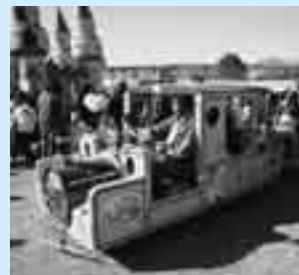
さまざまな催しが