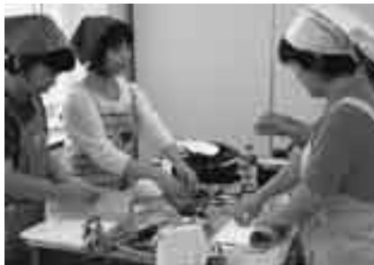
巻き上がりを楽しみに