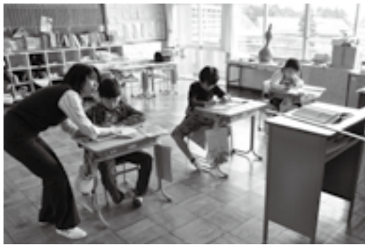
支援教員の配置で個別指導も十分に

それを解消するのが小規模学校支援教員で、市内には4人が配置されています。1学年1教師で授業が行えるように配属され、担任の先生と協力して複数の学年を指導しています。ほとんどの授業は学年別で行い、音楽や体育などは合同で行うなど工夫をしています。小規模学校支援教員がいることで、学年別学習と、社会性・協調性を身に付けるための他学年との合同学習を織り交ぜた多様な指導が可能となっています。