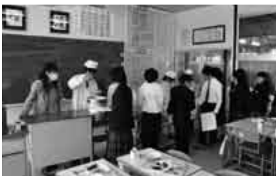
給食の準備も推進教員と一緒に

少人数学習推進教員は、授業だけでなく、休み時間や給食も子どもたちと共にし、部活動の指導にも熱心に取り組むなど子どもた