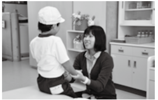
先生の笑顔で子どもも元気に