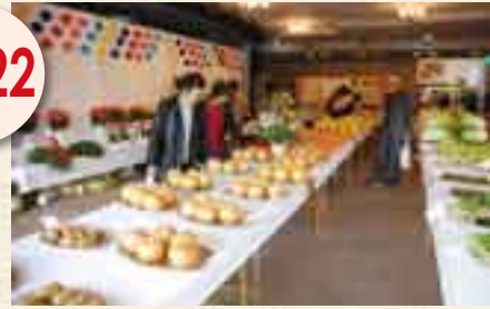
丹精込めた農産物がズラリ(産業まつり)