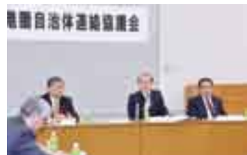
周辺自治体と協議(13日)