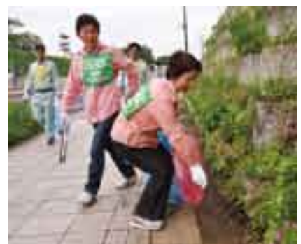
皆でまちをきれいに(環境美化運動)

その活動として、ゴミゼロ運動や緑化運動といった環境美化運動、ボランティア活動、文化、スポーツなど、幅広い分野でその精神が生かされ、子どもから大人まで成田市に住む一人一人がよりよい郷土を作り上げていくために実践さ