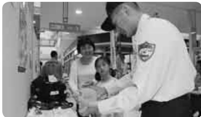
消防士の説明に熱心に聞き入る親子

防災と救急についての知識を多くの人に身に付けてもらおうと「防災フェアなりた&救急キャンペーン2009」が9月12日・13日、イオンモール成田で行われました。会場には、防災・救急関連用品の展示コーナーや耐震相談コーナーなどが設けられたほか、手品ショーや救急活動の寸劇なども行われ、訪れた子どもたちも大喜び。救急隊員の説明によるAED(自動体外式除細動器)の取り扱いや心肺蘇生法の体験には、多くの市民が参加し、応急手当について積極的に学んでいました。