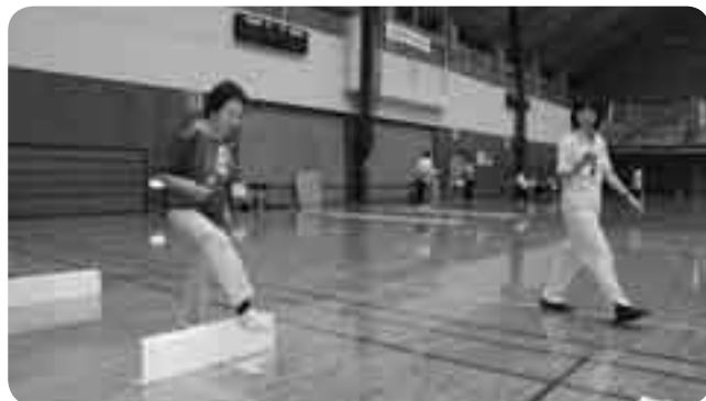
障害物歩行に取り組む参加者

自分の体力や運動能力を分析することで健康づくりに役立ててもらおうと、フィットネスハウス・アリーナ(中台体育館)で9月13日、「体力運動能力調査」が開催されました。参加した30～70歳代の25人は、上体起こしや立ち幅跳び、障害物歩行などで運動能力をチェック。それを基にスポーツプログラマーによる総合評価を受けました。「続けられることから始めてみては」とのアドバイスを受けた参加者は「まずは散歩からですね」と体力づくりに意欲を見せていました。