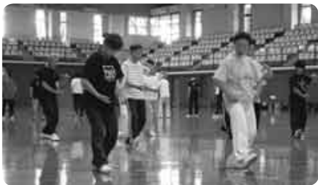
健康維持にいかが

フィットネスハウス・アリーナ(中台体育館)で9月6日、「太極拳教室」が行われました。これは、成田市太極拳連盟が太極拳の魅力を知らせようと年に数回開催しているもの。初心者約20人を含めた約60人の参加者は、熟達度などに合わせて4つのグループに分かれ、講師から身振り手振りを交えた丁寧な指導を受けました。参加者の一人は「体に酸素がたくさん入ってきて、すがすがしい気分になった。もっとやりたいと思いました」などと話していました。