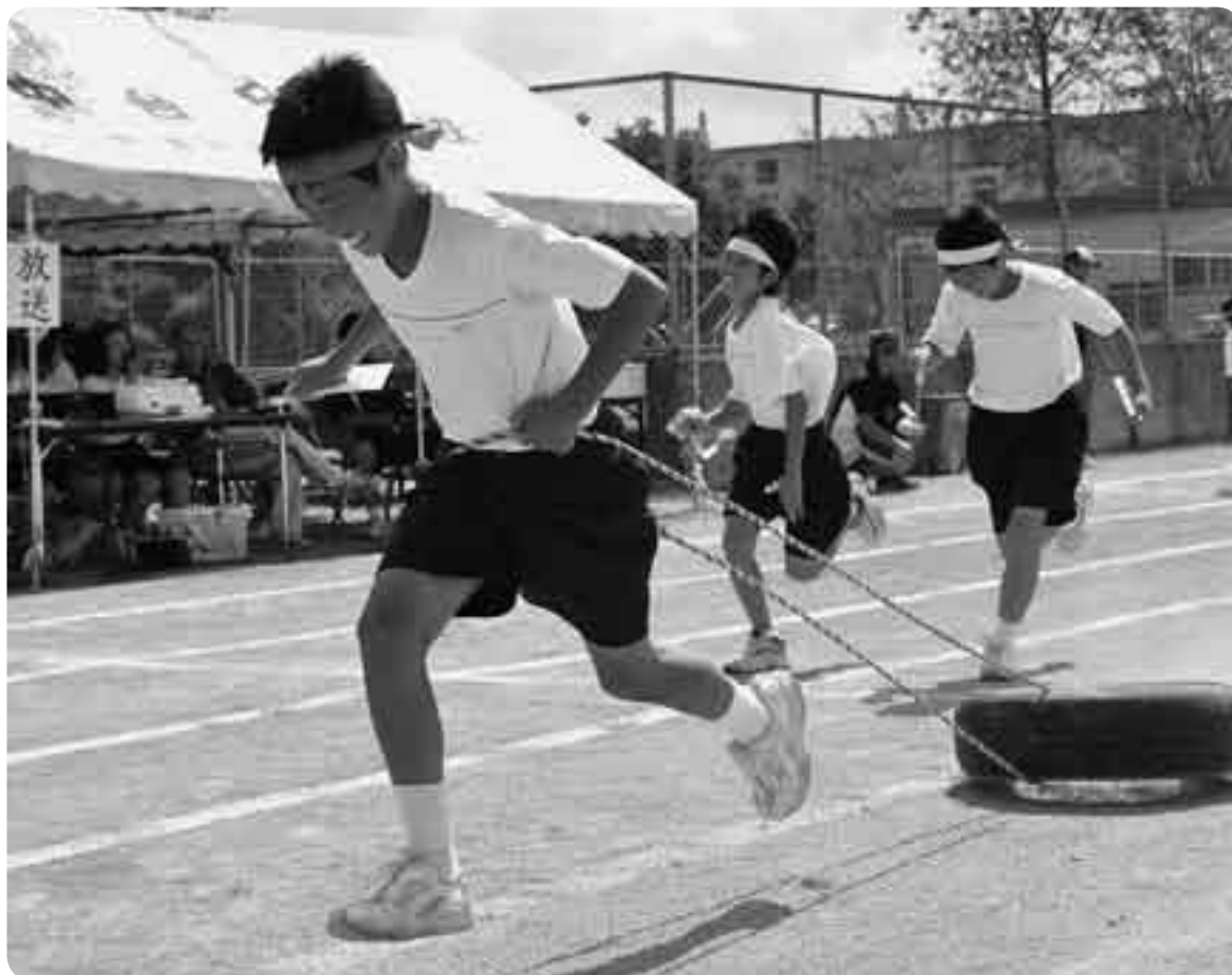
1位を目指して走り抜け！（中台中）