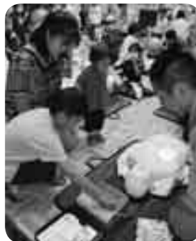
初めて触れるAEDに少し戸惑い気味

防災と救急についての知識を多くの人に身に付けてもらおうと「防災フェアなりた&救急キャンペーン2009」が9月12日・13日、イオンモール成田で行われました。会場には、防災・救急関連用品の展示コーナーや耐震相談コーナーなどが設けられたほか、手品ショーや救急活動の寸劇なども行われ、訪れた子どもたちも大喜び。救急隊員の説明によるAED(自動体外式除細動器)の取り扱いや心肺蘇生法の体験には、多くの市民が参加し、応急手当について積極的に学んでいました。