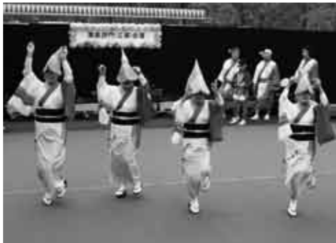
広場でもいろいろな発表が

市内13カ所の公民館で活動しているサークルが、日ごろの成果を発表する「公民館まつり」が中央公民館で開催されます。