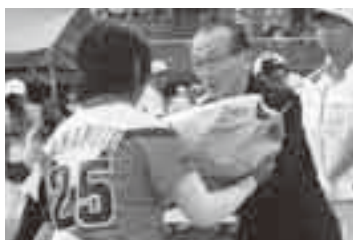
優勝チームに地元の特産品を(27日)