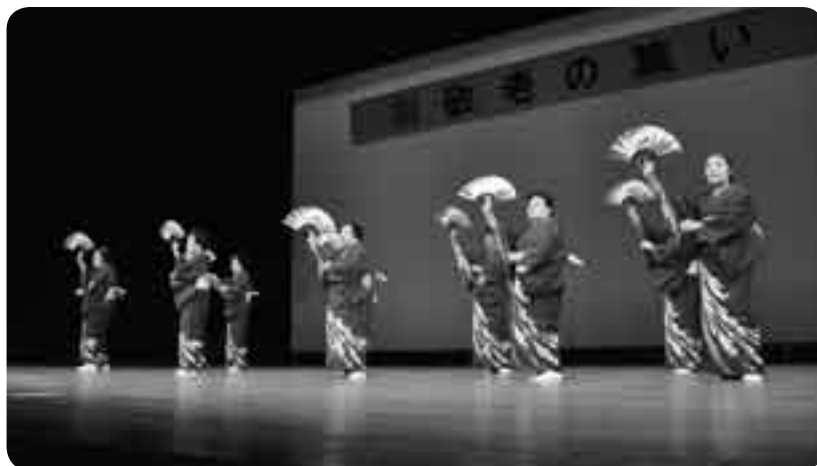
息の合った踊りを披露

敬老の日にちなみ、70歳以上の人を招待する「敬老会」が9月19日・20日、国際文化会館で行われました。大勢の参加者が集った大ホールでは、小学生による作文の朗読や「シルバーいきいき作品展」入賞者の表彰が行われ、一番の見所となる芸能発表会では、踊りや合唱などの多彩な芸が披露されました。