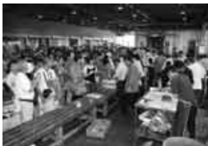
生マグロの解体実演即売は大人気

市公設地方卸売市場では、毎月第4土曜日に「成田市場わくわく感謝デー」を開催しています。新鮮な食材の買い出しに、利用してください。