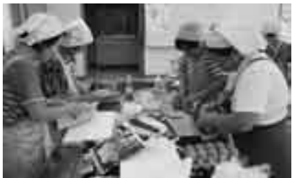
出来上がりが楽しみ