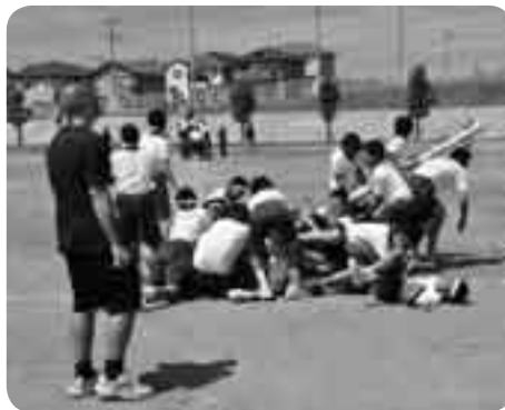
棒倒しは男の戦い（久住中）

市内では9月に入り、多くの小中学校で運動会・体育祭が開催されました。リレー、綱引き、親子レースなど数々の競技に、選手・観客は大熱狂。各地で笑いあり涙ありのドラマが繰り広げられました。