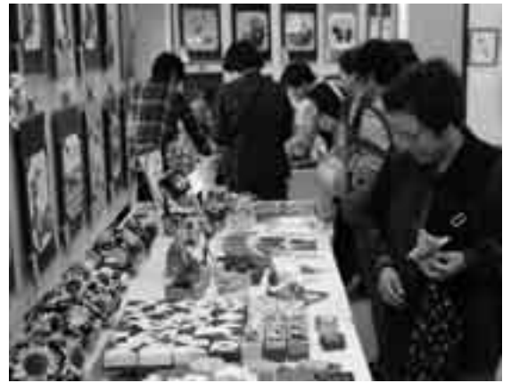
日ごろの成果がズラリ