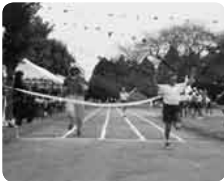
100m走には特別ゲストも（東小）