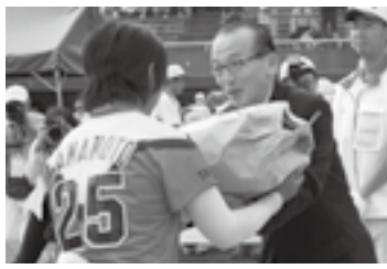
優勝チームに地元の特産品を(27日)