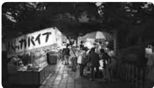
御利益を求めて来た人でにぎわう境内

「 しまんほっせんじち 四万八千日」は、毎年8月9日に滑川地区の龍正院(滑河観音)で行われている伝統行事。この日にお参りをすると、四万八千日お参りをしたのと同じ御利益があるといわれています。今年も境内にはたくさんの露店が出て、いつもは落ち着いたたずまいの龍正院が、参拝に来た善男善女でにぎわっていました。