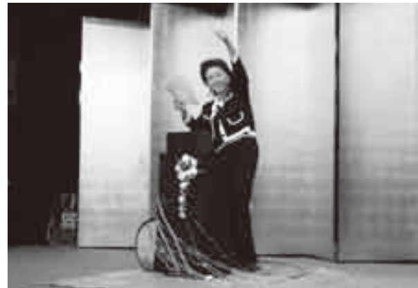
マジックは子どもにも人気