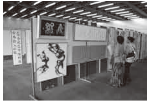
秀作がズラリと並ぶ