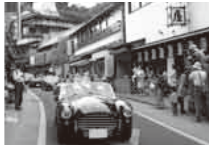
表参道を走る「芸術品」

この大会は、アジアで最大の国際クラシックカー連盟公認の国際大会で、毎回著名人が参加することでも話題になります。