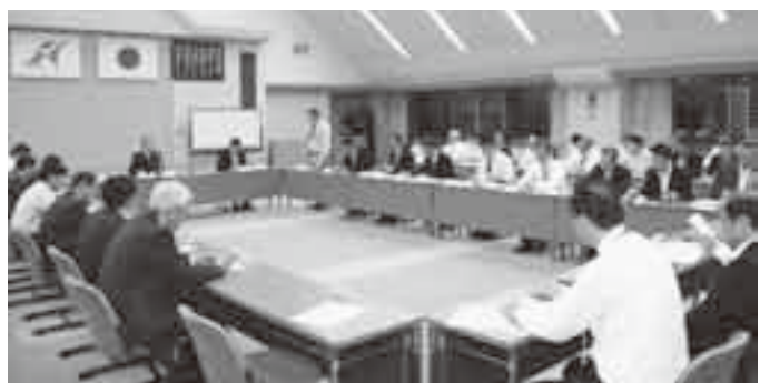
対策会議で迅速な情報の収集・提供を

に行うため、市長を本部長とする「成田市新型インフルエンザ対策本部」を設置しました。 対策本部では、市民の健康を守るため、県の方針に沿って対策を進めていきます。また、県をはじめとした関係機関と連携しながら、迅速な情報の収集・提供に努め、感染の拡大をできる限り抑制していきます。 最新の情報は市ホームページ( http://www.city.narita.chiba.jp )で速やかに提供していきます。 ※くわしくは危機管理課(☎20-1523)または健康推進課(☎27-1111)へ。