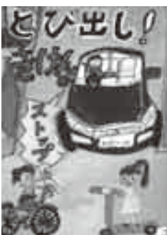
小学校低学年の部