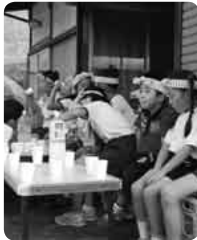
冷たい飲み物でしばしの休憩

わらで編んだ大綱を担いだ子どもたちが地区の家々を練り歩く盆の伝統行事「盆綱」が8月13日と15日、赤荻地区で行われました。のどかな田園風景の中をちよちんの明かりをゆらゆらと揺らしながら綱を引く様は、夏の風物詩として市内各地で見られたものですが、現在は少子化の影響などでだいぶ少なくなってきました。子どもたちは「やーっさい、やーっさい」と元気よく叫びながら、夜遅くまで綱を引いていました。