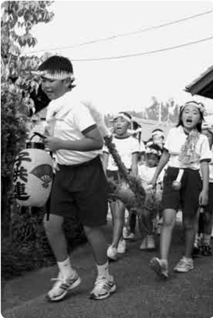
幼稚園児～小学生たちが元気よく綱を引く

わらで編んだ大綱を担いだ子どもたちが地区の家々を練り歩く盆の伝統行事「盆綱」が8月13日と15日、赤荻地区で行われました。のどかな田園風景の中をちよちんの明かりをゆらゆらと揺らしながら綱を引く様は、夏の風物詩として市内各地で見られたものですが、現在は少子化の影響などでだいぶ少なくなってきました。子どもたちは「やーっさい、やーっさい」と元気よく叫びながら、夜遅くまで綱を引いていました。