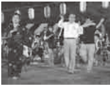
盆踊りの輪に加わって(16日)