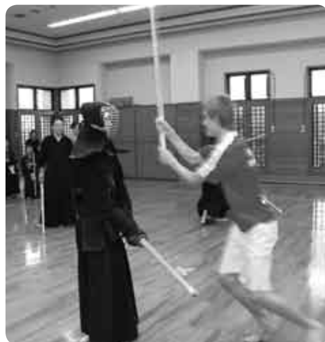
剣道で「サムライ魂」を体験

日本とドイツのスポーツ少年団同士の交流を図ろうと「日独スポーツ少年団同時交流」が行われ、ドイツ団が8月5日～10日、成田市を訪れました。これは国際経験豊かな指導者を育成するため、日独両国のスポーツ少年団のリーダーが互いに相手国を訪問し、各地でホームステイやスポーツ交流などを行う交流事業です。滞在中、フィットネスハウス・アリーナ(中台体育館)で行われた「お別れレクリエーション」では、市スポーツ少年団の子どもたちと剣道、卓球、バレー、ミニバスなどを楽しんだ後、ホストファミリーたちと会食をするなどし、交流を深めていました。