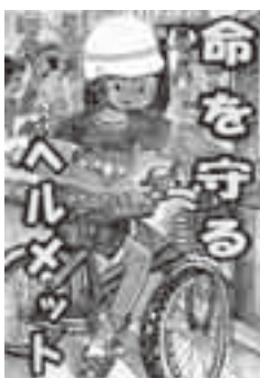
小学校高学年の部