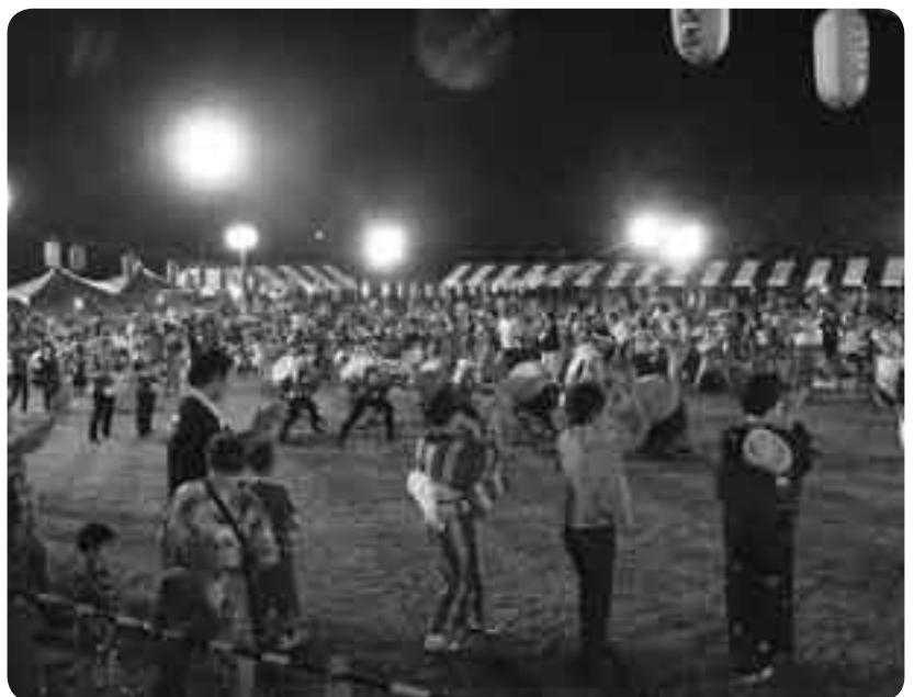
威勢よく打ち鳴らされる太鼓に合わせて

下総地区の夏の恒例行事「下総ふるさとふれあい納涼まつり」が8月16日、下総運動公園で開催されました。大勢の人出でにぎわう会場のメインステージでは、キャラクターショーや抽選会などのイベントがめじろ押し。立ち並ぶ露店での買い物や花火など、訪れた人たちは夏祭りならではの楽しみを満喫していました。