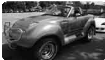
かっこいいカスタムカーに乗って

市民に市内の施設を紹介し、市政への理解を深めてもらおうと、広報課では「市内施設見学会」を実施しています。8月18日に行われた親子