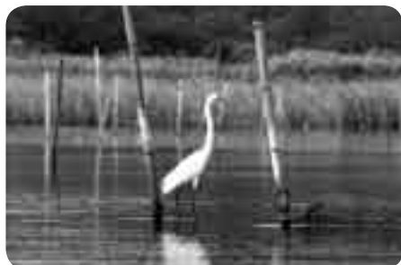
多様な生物が生息

身近な印旛沼の自然を屋形船で観察しようと8月19日、「印旛沼自然観察会」が行われました。これは毎年行われているイベントで、西印旛沼の佐倉ふるさと広場