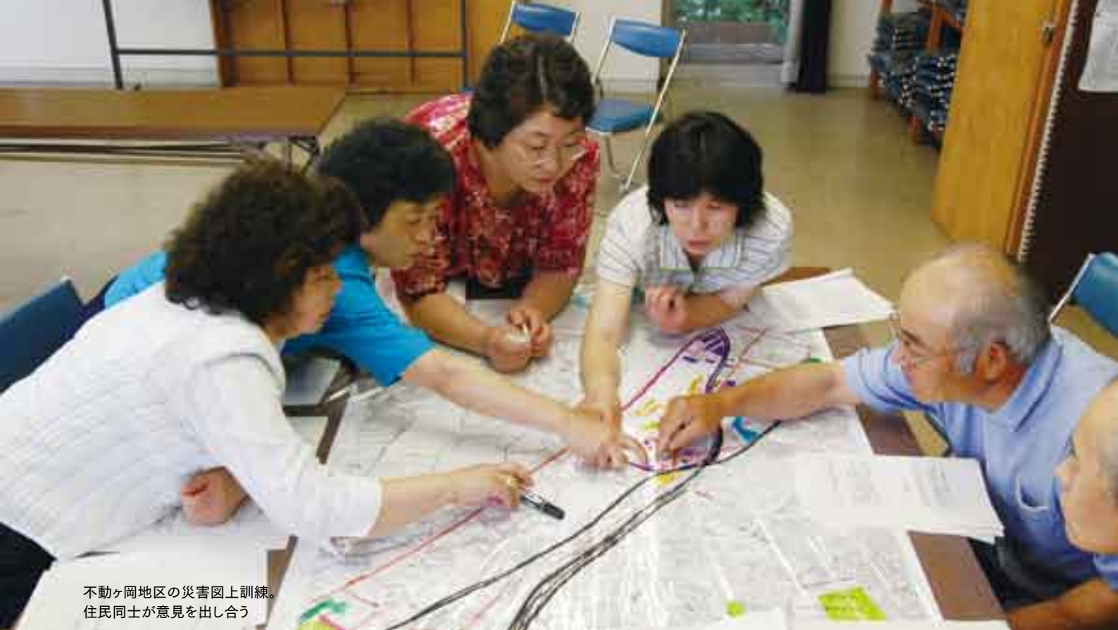
不動ヶ岡地区の災害図上訓練。 住民同士が意見を出し合う