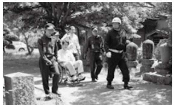
車いすを用いた災害時要援護者救助訓練

域団体(区・自治会・町内会など)、消防団、消防署に開示し、地域で要援護者の支援協力をする仕組み作りをしていただく制度です。