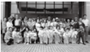
表敬訪問に来た警護当番町(幸町)の稚児たちと(10日)