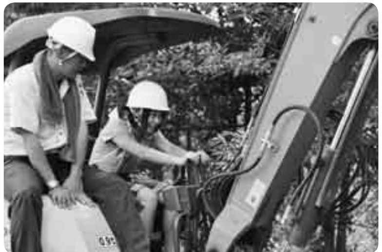
ミニバックホウのレバーを慎重に操作

工事現場などで使われる機械の操作などをキャリア教育の一環として小学生が体験する「建設機械体験学習会」が7月7日、豊住小学校で行われました。学校のグラウンドにはさまざまな建設機械が用意され、操作方法や注意事項の説明の後、児童自らがそれぞれの機械の操作に挑戦。自分たちが操作する機械の重厚な動きに、児童たちからは絶えず歓声が上がっていました。