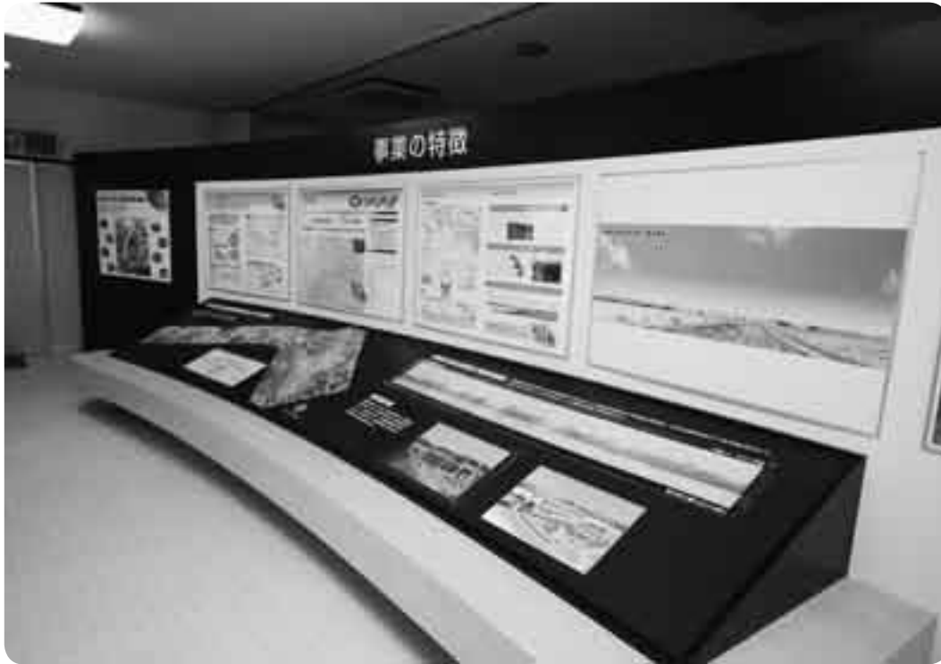
事業の目的や整備内容などの資料が展示