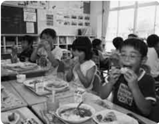
甘くておいしいよ

地元農産物を味わってもらおうと7月10日、下総地区の小中学校の給食でトウモロコシがふるまわれました。トウモロコシは下総高校の生産技術科の生徒たちが育てたもの