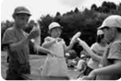
丁寧に皮をむいていく児童たち

を前日に小御門小学校の児童が一つ一つ丁寧に皮をむいたものです。“地元の恵み”をほおばった児童・生徒たちは「ジュワツと甘くておいしい」と話していました。