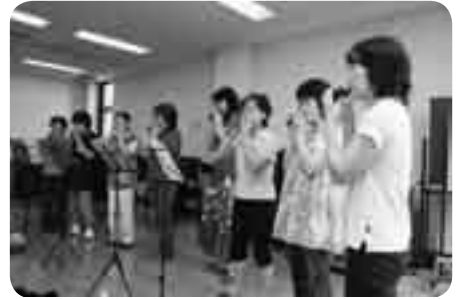
最終日にはみんなで演奏会

5月~7月にかけて「オカリナ教室」が、玉造公民館で行われました。参加者は最初の2回で粘土製のオカリナを製作し、後半の5回で演奏の練習をしていきました。