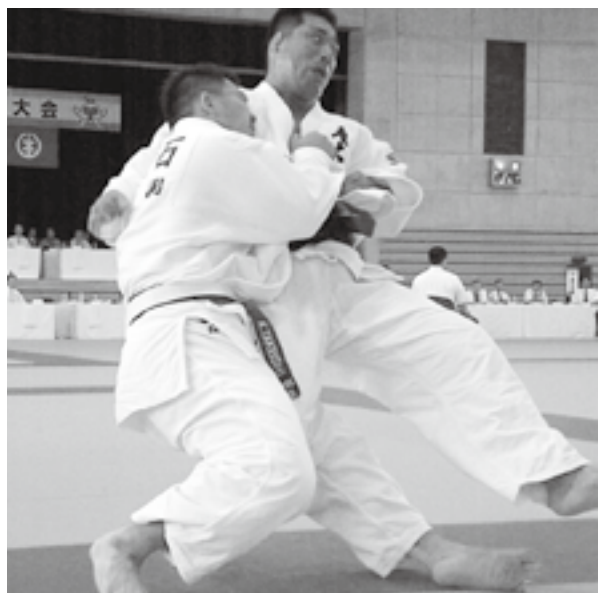
心・技・体のぶつかり合い—柔道競技