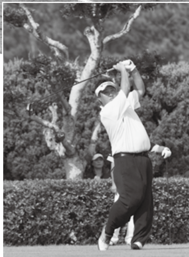
難コースの攻略なるか—ゴルフ競技