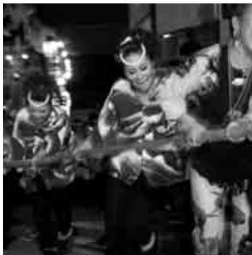
暗くなるまで威勢よく続く