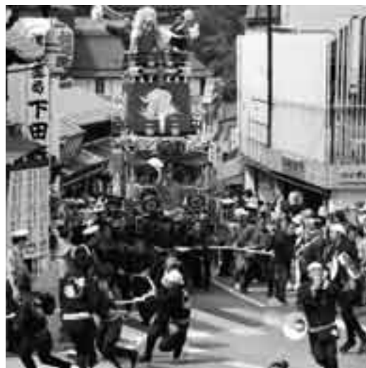
仲之町の急坂を勇ましく駆け上がる(総引き)