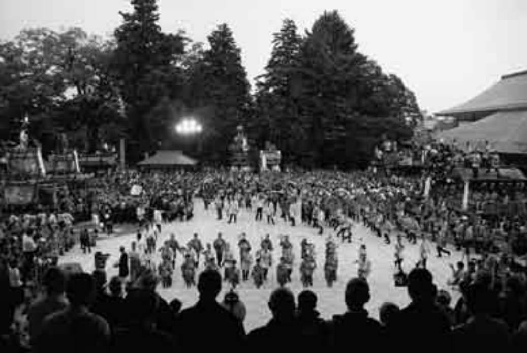
大本堂前に山車・屋台が勢ぞろい(大本堂前総踊り)