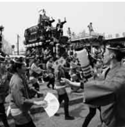
駅前を埋め尽くす「祭人」たち(駅前総踊り)