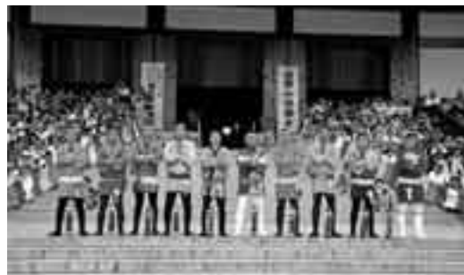
りりしい法被姿の若者頭たち