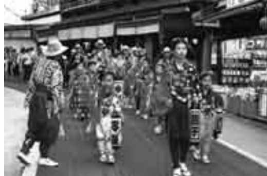
祇園祭を華やかに飾る手古舞