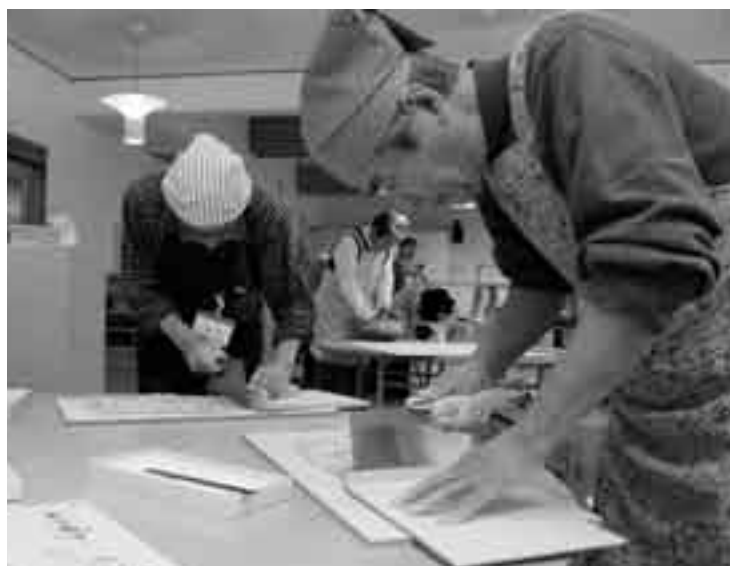
「きしめんみたいになっちゃったよ」なんて声も