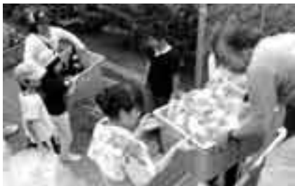
子ども会での活動も

※申し込みはクリーン推進課(☎20-1530)または下総支所農産土木課(☎96-1112)、大栄支所農産土木課(☎73-8063)へ。