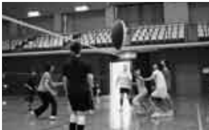
ラリーをつなげて

日時=1月18日(日) 午前9時受付開始 会場=市体育館 種目=一般の部(中学生以上)、小学生の部 チーム編成=6人制・男女混合(女子3人以上、女子のみも可) 参加費=1チーム1,000円 ※申し込みは1月9日(金)までに市レクリエーション協会事務局(生涯スポーツ課・☎20-1584)へ。