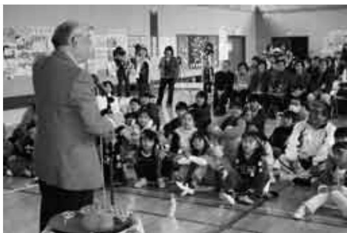
飛び入りのマジックで会場は和やかに

地域のお年寄りと子どもたちのふれあいを目的に11月13日、久住第二小学校で「ほのほの集会」が開催されました。会場となった体育館では、子どもたちの歌やダンス、お年寄りの大正琴や合唱、フラダンスなどが披露され、和やかな雰囲気に。その後、子どもたちが作ったサツマイモを一緒に食べたり、射的や輪投げなどで遊んだり、会場のあちこちに笑顔の輪が広がりました。