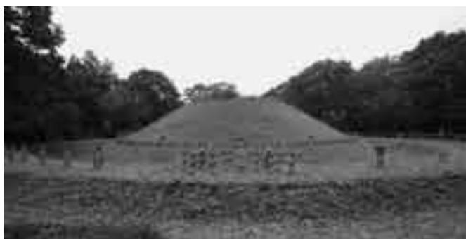
埴輪列が再現され、築造当時の様子が分かる円墳「101号墳」(大竹・国指定重要文化財「学習院初等科正堂」隣接)