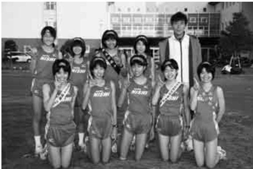
「駅伝大好き！」なメンバーたち

女子4×1000mリレー連覇で全国を沸かせた西中学校陸上競技部。今度は女子駅伝チームが全国の舞台に挑みます。同チームは、11月5日に行われた県中学校駅伝大会で優勝。市内初となる「全国中学校駅伝大会」への出場を決めました。全国大会でのチームの目標は「上位入賞」。12月21日(日)、山口県セミンナーパーク(山口市)で強豪校を相手に熱戦を繰り広げます。競技の様子は1月3日(土)午前6時からBS朝日で放送予定です。