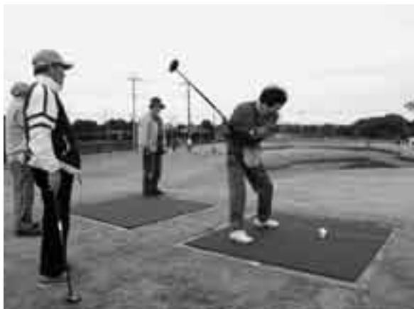
コースをよく見て慎重にショット

今年8月にオープンした十余三パークゴルフ場で11月10日、「第1回市民パークゴルフ大会」が開催されました。パークゴルフは、1本のクラブを使用し、カップインさせるまでの打数を競うニュースポーツ。コースは20m~100m。初心者も気軽に参加できるということで、参加者の一人は「ルールもシンプルなので、下手なわたしでも楽しめます」と笑顔をのぞかせていました。ゴルフ場オープン後初となるこの大会には、48人が参加。真剣なまなざしでプレーに向き合いながらも、参加者同士談笑を交えながら、スポーツの秋を満喫していました。