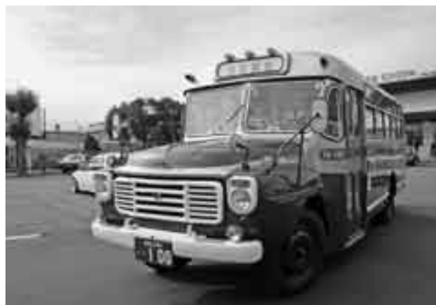
JR成田駅前を通過中の昭和40年式いすゞ自動車BXD30型ボンネットバス

千葉交通が創立100周年を記念して、11月9日～23日の間、成田山門前・宗吾霊堂間でボンネットバスの運行をしました。このバスは、岡山県高梁市の備北バスで運行されていたボンネットバスで、その後は物置として使用されていました。それを神奈川県相模原市の愛好家が再生し、イベントで走らせていたものを千葉交通が借り、営業ナンバーを取得したものです。コースは、千葉交通の前身「成宗電気軌道」がチンチン電車を走らせていたルート。昭和の薫りを漂わせ、往年の「銀バス」カラーに復元されたボンネットバスには期間中延べ3,263人が乗客し、レトロ感に浸っていました。