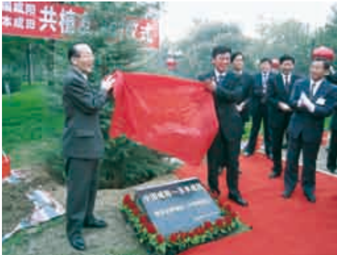
記念碑の除幕を行う小泉市長と千軍昌咸陽市委員会書記