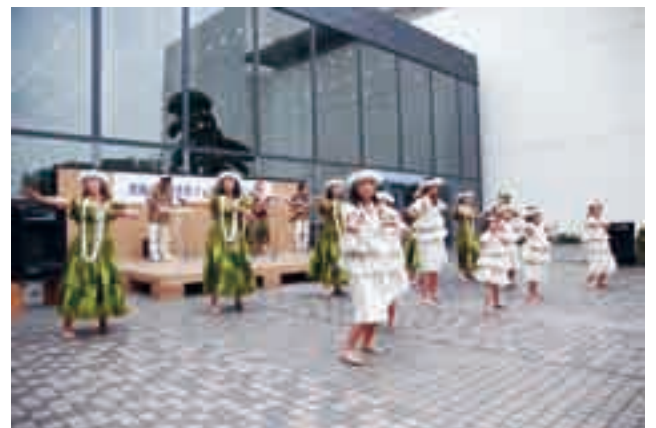
情緒あるハワイアンミュージックに合わせて

国際色豊かなイベントや食を楽しんでもらおうと10月5日、国際文化会館で「国際市民フェスティバル」が開催されました。中庭に用意された特設ステージでは発表会が行われ、さまざまな国の民族衣装などに身を包んだ出演者たちが、歌やダンスを披露。また、館内には、日本の伝統文化を体験したり、ゲームを楽しんだりできるアトラクションコーナーも設けられ、会場は多くの親子連れでにぎわいました。