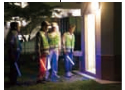
公園は要チェック場所