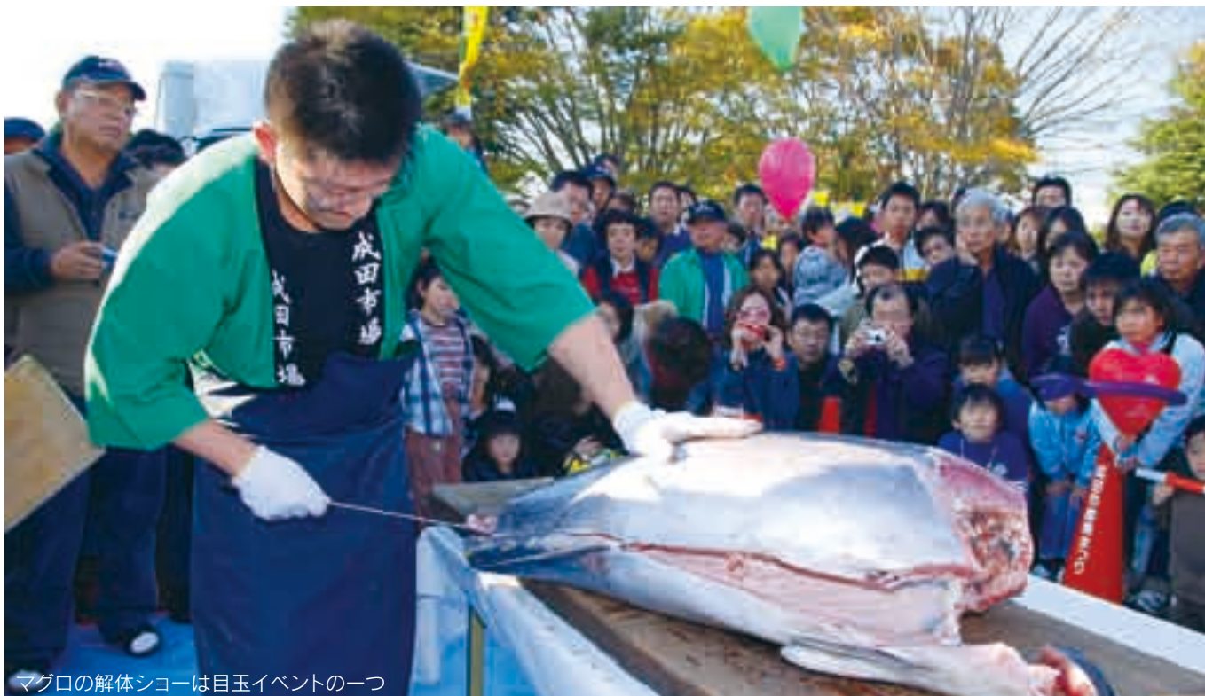
マグロの解体ショーは目玉イベントの一つ