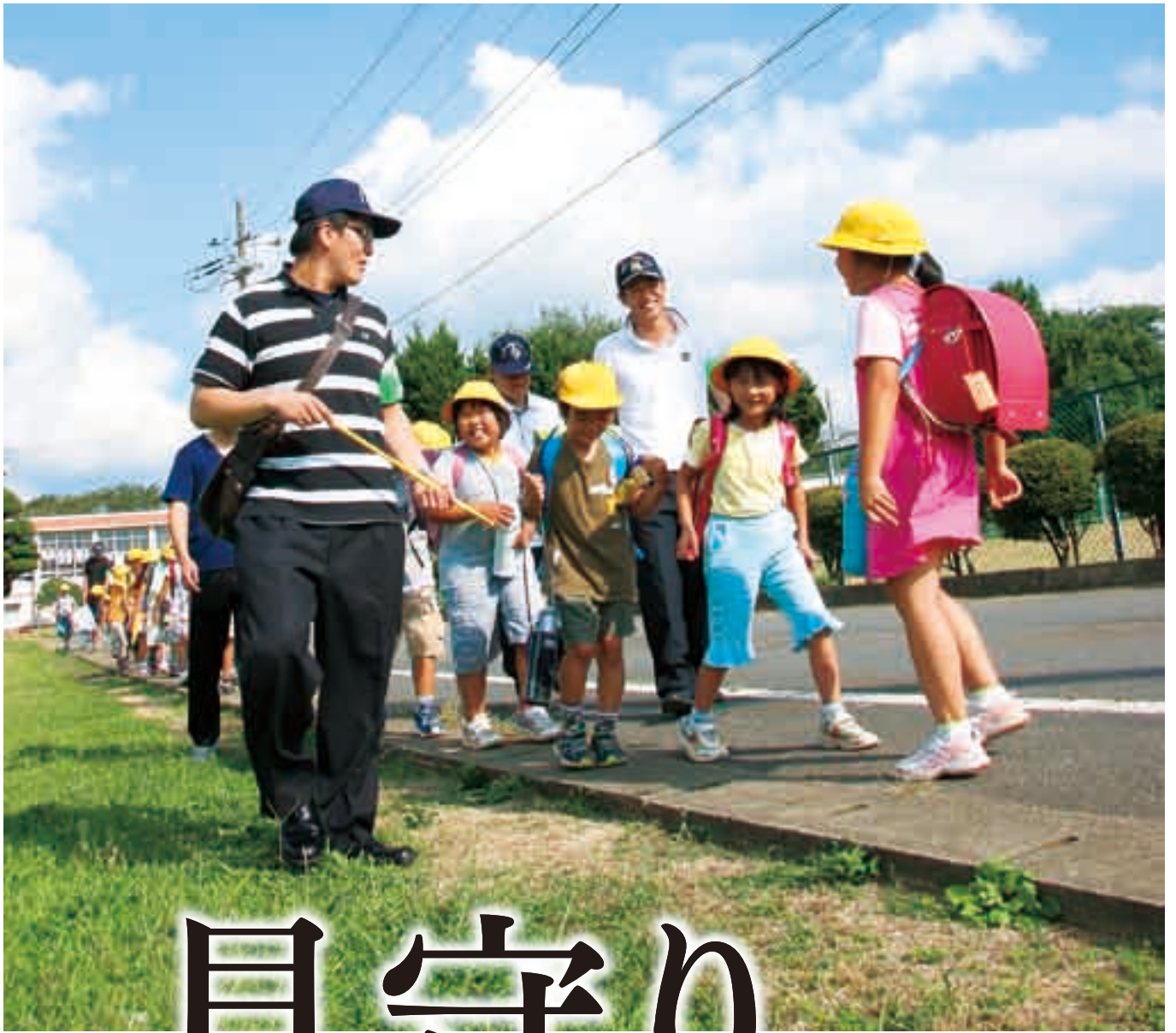
「今日のご飯は何かな」。思い思いの会話を交わし帰路につく(遠山小学校)