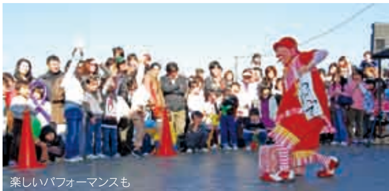
楽しいパフォーマンスも