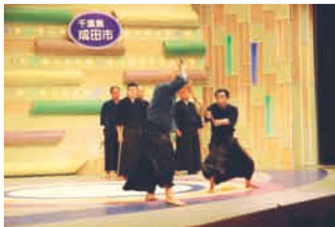
気迫のこもった香取神道流の実演