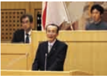
中学生議会で答弁する小泉市長