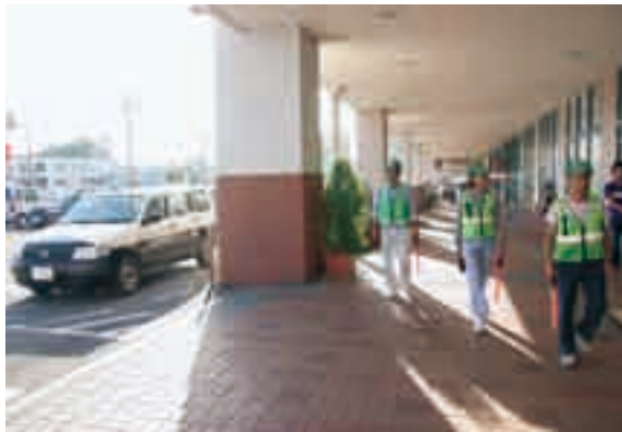
防犯重点箇所では徒歩でも警戒