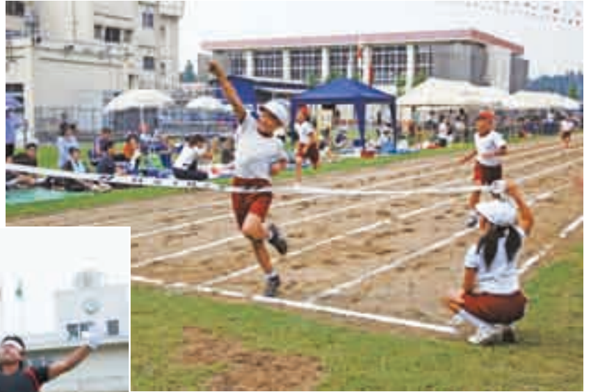
一着でゴール(中郷小学校・13日)