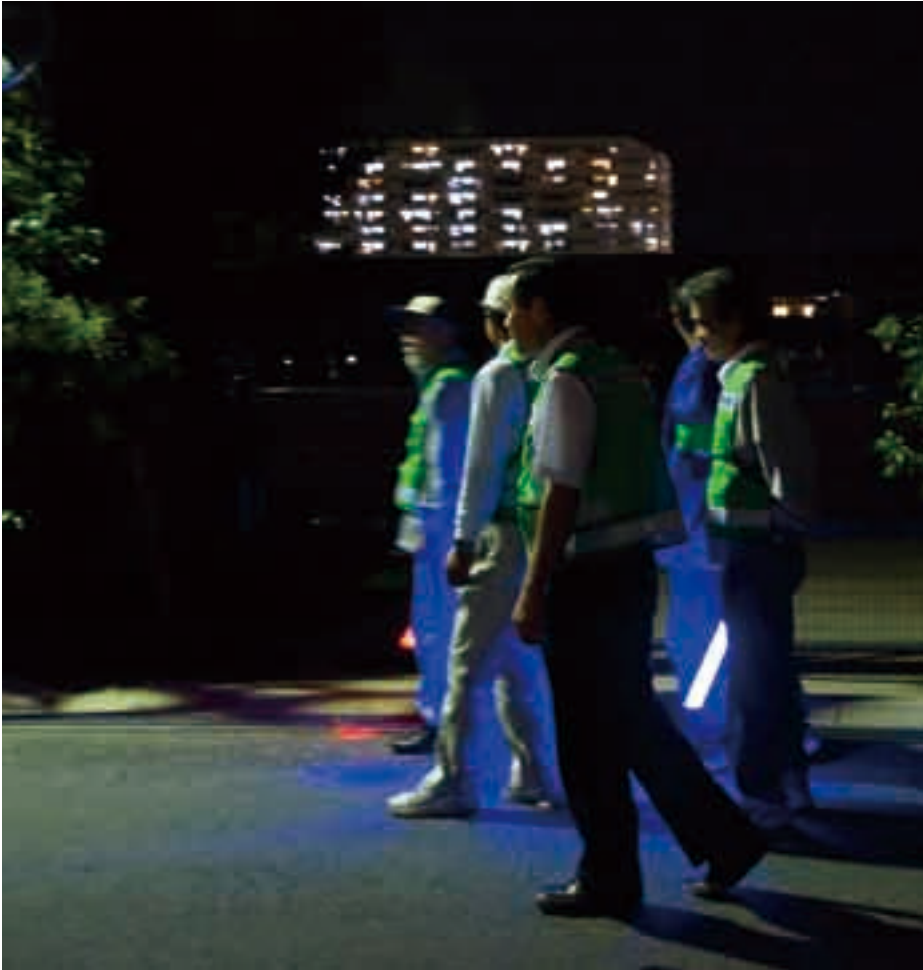
巡回に向かうパトロール隊。青色合図灯が暗かりを照らす