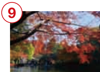
紅葉の季節です(成田山公園)