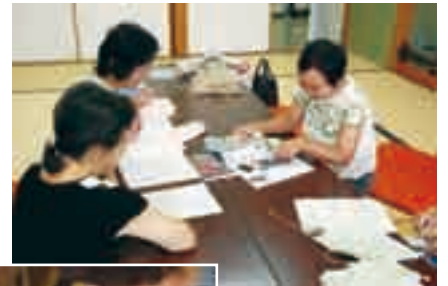
「これなんか似合うんじゃない」