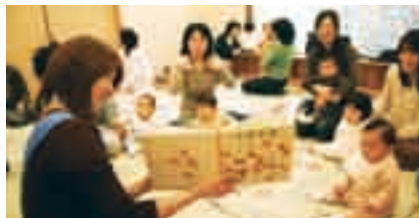
あかちゃんはえほんがだいすき

日時＝11月14日(金) 午前11時～11時30分 会場＝市立図書館1階おはなし室 対象と定員＝0・1歳児と保護者・12組(初めての人を優先に先着順) ※参加費は無料です。申し込みは市立図書館(☎27-4646)へ。