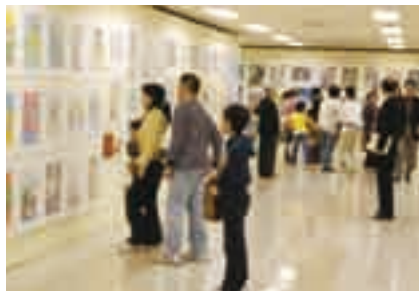
たくさん作品が並びます

期間＝11月1日(土)～16日(日) 時間＝午前9時～午後3時30分 会場＝成田山新勝寺大本堂第二講堂 ※入場は無料です。くわしくは生涯学習課 (☎20-1583)へ。