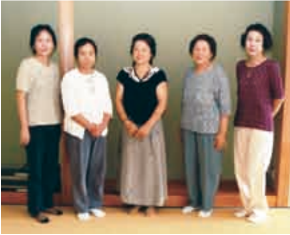
思い通りの作品を編んでみませんか