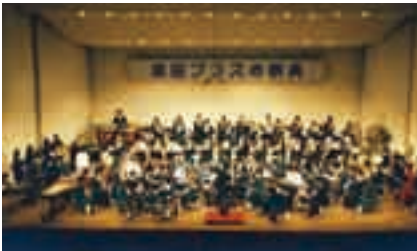
生演奏の迫力を実感

日時＝11月24日(月・休) 午後1時30分 開演(開場は午後1時) 会場＝国際文化会館大ホール 出演校＝成田高校音楽部、成田国際高 校・成田北高校・東京学館高校・千 葉黎明高校の各吹奏楽部 入場料＝無料(全席自由) ※くわしくは国際文化会館(☎23-1331、 11月17日(月)は休館)へ。