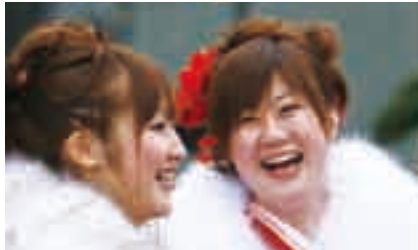
懐かしい友達と再会