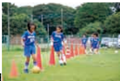
それぞれに目標を持って レベルアップを図る