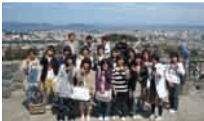
あこがれのアメリカ西海岸へ

派遣期間＝3月24日(火)～31日(火) 派遣先＝アメリカ・サンブルーノ市ほか 対象＝市内に住む中学2年生で、原則として来年7月上旬にサンブルーノ市中学生のホームステイ(2人1組を3～6泊)受け入れが可能な人 定員＝男女各10人程度(選考) 参加費＝100,000円程度(パスポート取得費や保険代は各自で負担) 選考会＝12月13日(土) 申込方法＝11月28日(金)までに市国際交流協会事務局(広報課内)にある申込用紙に必要事項を書いて同協会事務局(〒286-8585 花崎町760 市役所3階)へ ※日程などは変更となる場合があります。くわしくは同協会事務局(☎23-3231)へ。