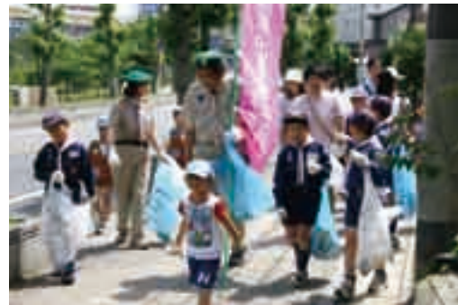
一人一人の心掛けが大切(ゴミゼロ運動)

神の実践活動を推進するために、その趣旨に賛同する市民団体で構成された「成田市市民憲章推進協議会」が設立されました。