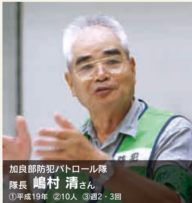
加良部防犯パトロール隊