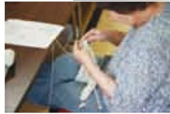
細かい作業には神経集中

ない手作り感。心を込めて作った世界に一つだけ、自分だけの作品を身に着けると、幸せな気分になれます。中には半年くらい掛けて、根気強く編むものも。プレゼントとして大切な人に送ることもしばしばです。