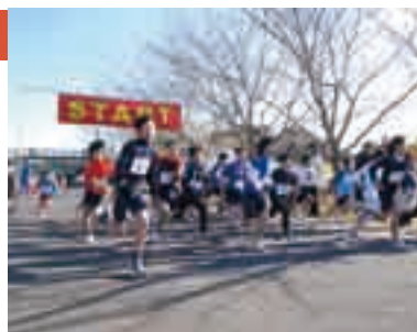
RUN! BIKE! RUN! がんばれー!

参加費＝小学生2,000円、中学生以上3,000円、駅伝(3人1組)6,000円 ※申し込みは大会事務局・加藤さん(☎090-3213-6535) Eメール pi7m-ktu@asahi-net.or.jp)へ。