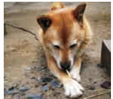
正しく飼ってほしいワン!