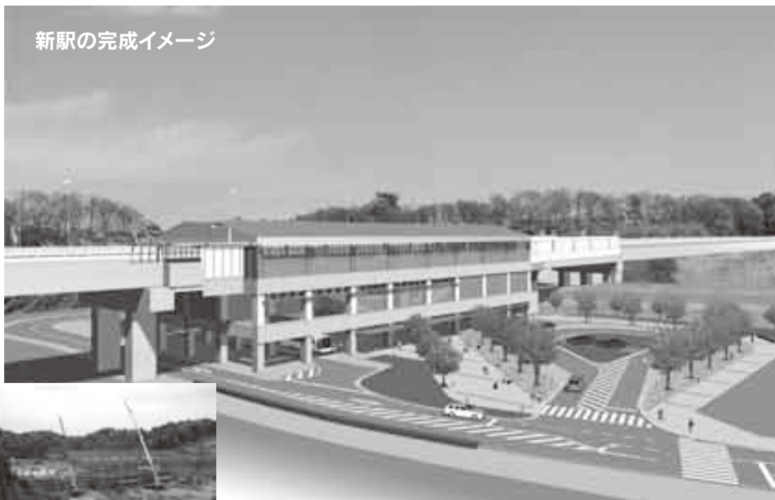
新駅の完成イメージ