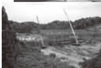
工事が進む新駅周辺

現在、京成上野駅から北総線を經由して成田空港駅に乗り入れる成田新高速鉄道の建設工事が、平成22年春の開業を目指して、市内でも急ピッチで進められています。