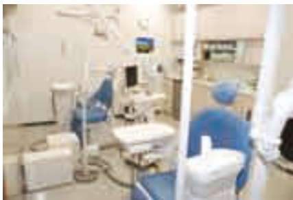
治療器具の充実した歯科診療室