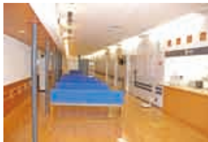
広々とした待合ロビー