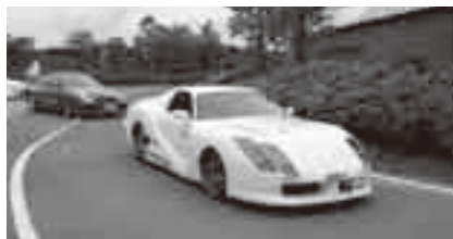
カッコいい車でGO(日本自動車大学校)