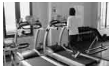
ウォーキングやランニングに