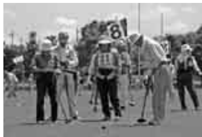
どなたでも楽しめます

期日=9月4日(木)・10日(水)・17日(水)・25日(木)、10月1日(水)・9日(木)・16日(木)・22日(水)、11月5日(水)・13日(木)・19日(水)・27日(木)、12月4日(木)・11日(木)(全14回) 時間=午前9時30分~11時30分 会場=中台運動公園野球場 対象=市内在住で全回参加できる人 定員=80人(応募者多数は初心者優先) 参加費=1,000円(テキスト代) 申込方法=8月15日(金)までに、往復はがきに住所・氏名(ふりがな)・生年月日・電話番号・性別・経験の有無・用具の有無を書いて、市体育協会事務局(〒286-8585 花崎町760 生涯スポーツ課)へ ※くわしくは同課(☎20-1584)へ。