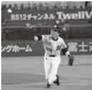
始球式で自慢の速球を披露