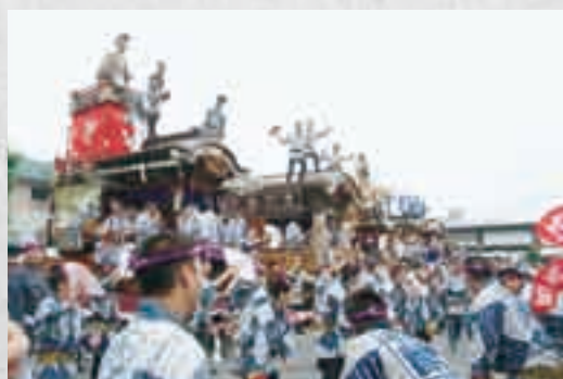
JR成田駅前に山車・屋台が勢ぞろい(5日)