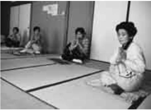
腹式呼吸で気分を落ち着けながら

ヨガは本来、古代インドで発祥した修行法ですが、日本では、健康体操として一般的に知られています。数分続けただけでも、体中がポカポカ。普段使わない筋肉が刺激され、いい運動になっています。しかも、疲れているときや気分が乗らないときに効果的です。わたしたちの生活と切っても切れないものになっています。