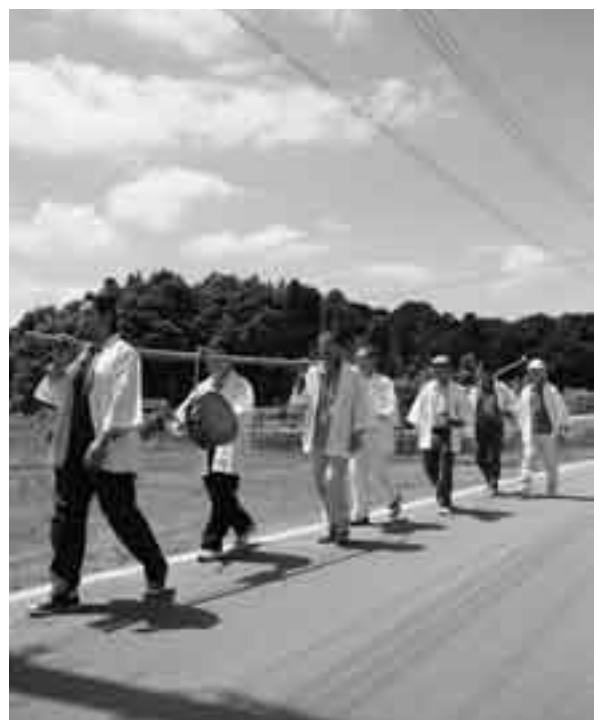
太鼓を叩きながら地区内を練り歩く