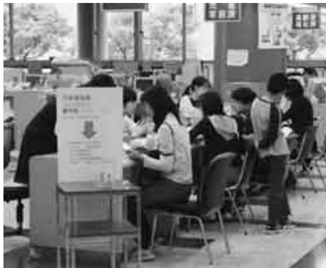
児童家庭課には児童手当などの手続きで86人が来庁

市民課や税務課など市民生活に関連の深い窓口を、毎月第2・第4日曜日にオープンする「休日窓口サービス」が6月からスタート。初日となった6月8日には、225人の市民の皆さんが市役所を訪れ、戸籍の届け出や、児童手当の手続きなどを行いました。休日窓口サービスは、仕事や家庭の都合などで平日に窓口に来られない市民の皆さんへのサービス向上を目的に行います。ぜひご利用ください。