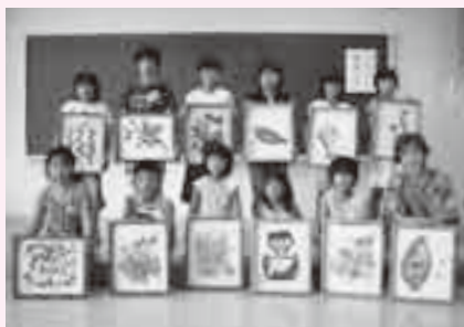
自分だけの作品作ろうよ

日時=7月29日(火)~8月1日(金)(全4回) 午後1時30分~4時 会場=公津公民館 内容=水墨画の基礎を学び、墨が持つ素朴な色合いだけで作品を仕上げ、作品を飾る手作りの額縁を作る 対象と定員=小学生(保護者も参加可)・20人(先着順) 参加費=1,000円(材料費) ※申し込みは午前9時~午後5時に公津公民館(☎26-9610、月曜日・7月22日(火)は休館)へ。