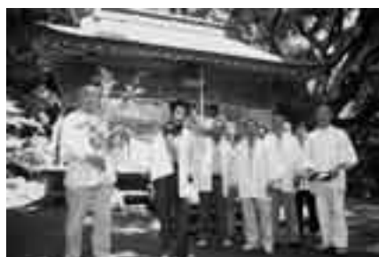
過去に使われていたサイズを再現した御太刀

山口地区の雷神社で催される夏祭りの最初の行事として6月1日、「御太刀行事」が行われました。この行事は、区長をはじめとする山口地区の代表者が、「御太刀」と呼ばれる木製の刀を担いで地区内の各戸を回るといったもの。以前の御太刀は何人もの大人が担がなければならないほどの大きさだったそうです。当日は、晴れ渡った初夏の空の下、軽快な太鼓の音とともに御太刀が地区内を回り、五穀豊穰・家内安全が祈願されました。