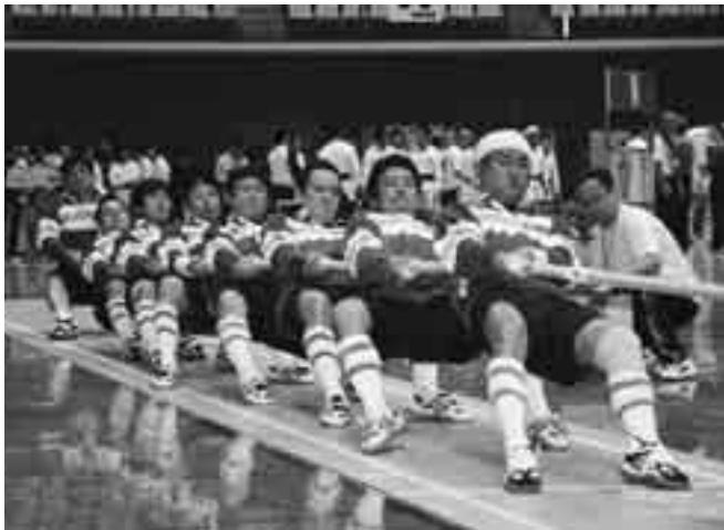
心を一つに綱を引く「成田『P』ULLS」の選手たち