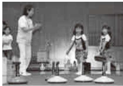
集中して投げよう