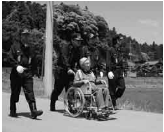
消防団による災害時要援護者救助訓練も

土砂災害危険箇所を抱える一坪田地区で6月1日、市内では初めてとなる「土砂災害防災訓練」が実施されました。降り続く雨の中、大雨洪水警報に続いて成田市に「土砂災害警戒情報」が発表されたとの想定で訓練が開始。がけ崩れの前兆現象が発生した一坪田地区には「避難勧告」が発令され、住民は速やかに避難。消防団による災害時要援護者の担架搬送や車いすを使った避難活動も行われるなど、本番さながらの訓練に、どの参加者も真剣に取り組んでいました。また、避難訓練終了後の防災講演会では、「土砂災害警戒情報」発令時などにおける早期避難の重要性が再確認されました。