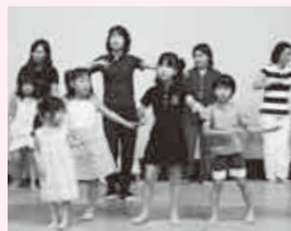
体全体を柔らかく

期日=7月24日・31日、8月7日・21日・28日の木曜日(全5回) 時間=午後1時30分~2時30分 会場=大栄公民館 内容=ハワイアンフラダンスの基礎 対象=女子小学生で初参加の人 定員と参加費=30人(先着順)・無料 ※申し込みは午前9時~午後5時に大栄公民館(☎73-7071、月曜日・7月22日(火)は休館)へ。