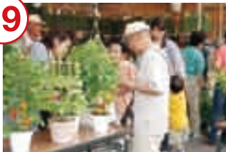
色付いたホオズキを求めて