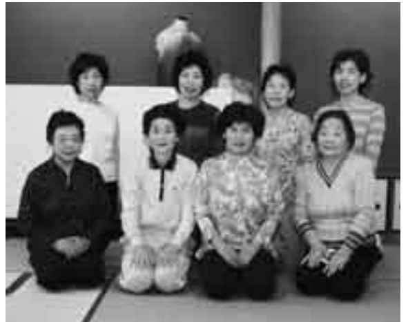
ヨガで自分を見つめ直してみませんか

ヨガは、「絞って開いて」の繰り返しと言えます。力を入れて体を緊張させる部分と、リラクセスして脱力する部分。この繰り返し、心と体に心地よい刺激を与えてくれるのです。中には、つらいポーズやストレッチもありますが、無理せずマイペースで、自分のヨガを見つめることが大切です。