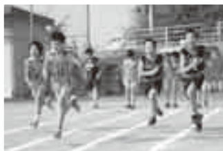
全力でスタート ダッシュ!

ぼくたち滑河小学校陸上部は、6年生19人、5年生17人、4年生8人の計44人で、ほぼ毎日、始業前と放課後の時間に学校のグラウンドなどで活動しています。 部活には4年生以上の児童全員が自主的に参加していて、それぞれ、高跳び・幅跳び・100メートル走・ハードル・長距離走・ボールスローといった種目ごとに練習しています。種目練習には、自分の好きな種目を選んで参加できたりで、メンバー全員が意欲的に部活に取り組んでいます。